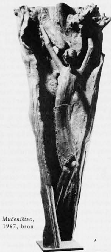
Mučeništvo, 1967, bron