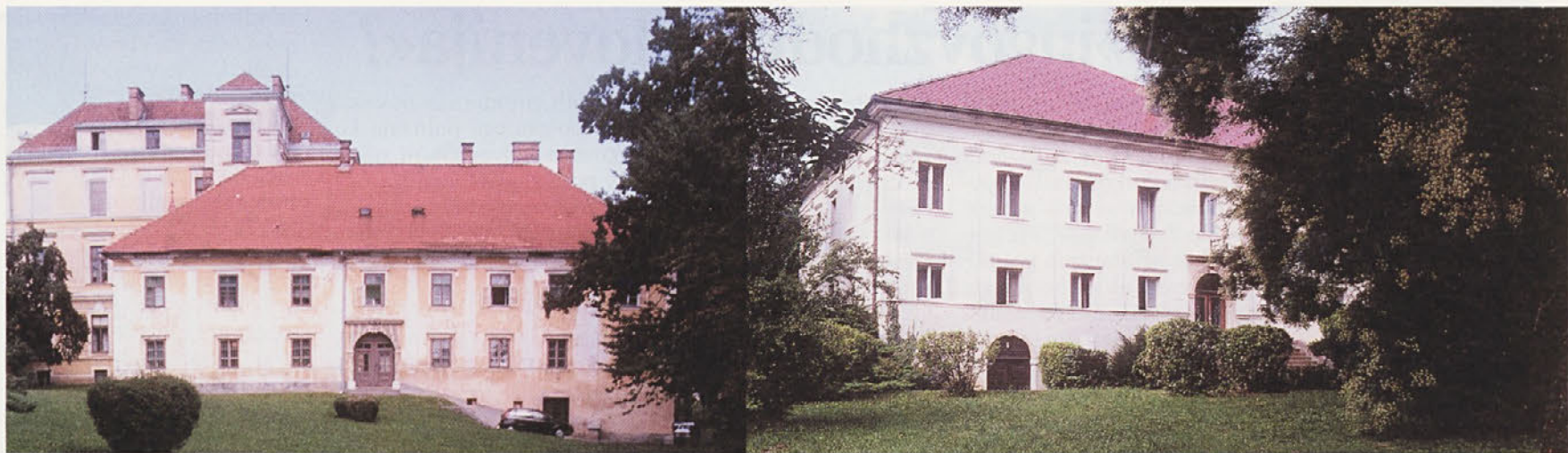
Novomeška gradiča Mostek (levo) in Kamen (desno) v svojem zelenilu sta pomembna kulturnozgodovinska spomenika našega mesta