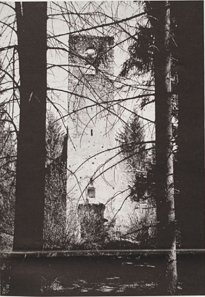
Kot zakleta kraljična sameva cerkvena sv. Roka na robu mesta – zaraščata jo gozd in čas