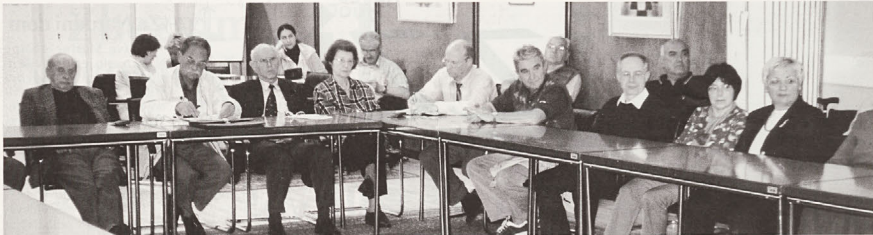
Javna razprava o razvoju naše pokrajine je pritegnila vrsto uglednih strokovnjakov, pa tudi zvestih meščanov, ki sta jim Dolenjska ter njeno naravno in zgodovinsko središče iskreno pri srcu, ni manjkalo