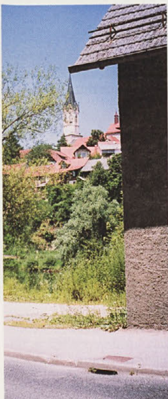
Toliko Brega in Krke pokrije zdaj »vavžikovina« - koliko ju bo šele »brikovina«!?

Obstoj civilne družbe predpostavlja tudi obstoj javnosti, možnost kritične presoje oblastnih ravnanj, omejitve v tej smeri pa so lahko samo odraz nedemokrati- Nadaljevanje na 3. str.