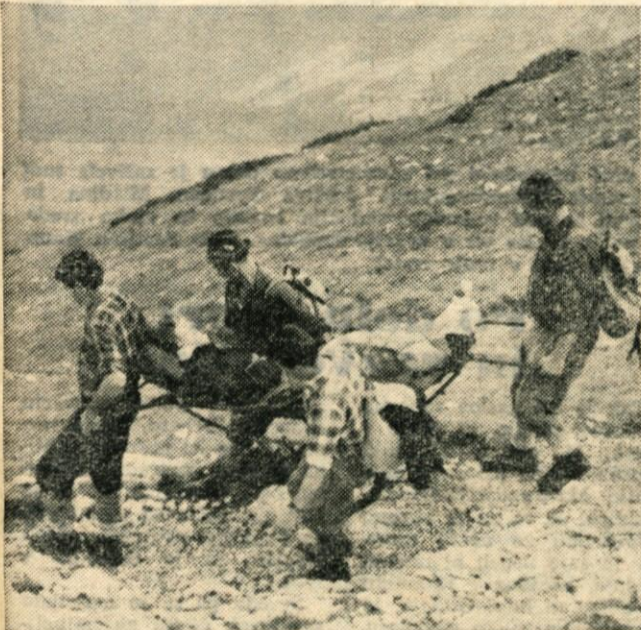
Kamniški gorski reševalci v akciji