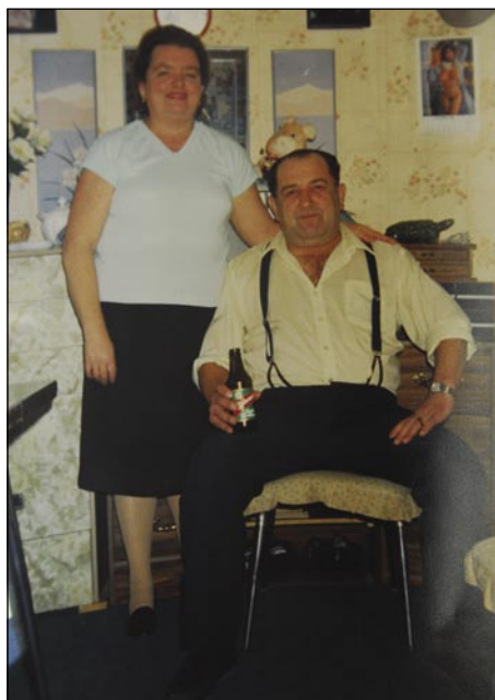
Šaugor, steri je 1956. leta odišo v Kanado s svojo ženov

pa z dva tjedna starim detetom se je nej gvüšno po svejta tepsti. Moža brat, moj šaugor (svak) je nej poslúšo, on je s sakalauvskov mladinov odišo, ka so šli njegvi padaštje tö. Tak si je mislo, če de njim tam dobro, te de njemi tö. Gda so taprejk vólke vodé prišli, so se razlaučili, on je v Kanado išo, drugi so pa v USA ostali. Tam je včasim delo daubo