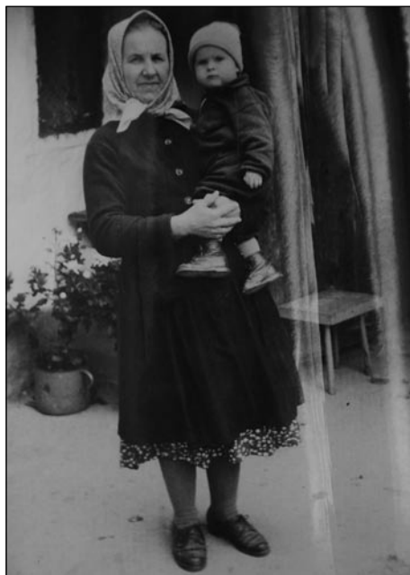
Moja tašča (anyós) s sinaum, gda je že malo vekši bijo

tistoga ipa so večernico Lučarini vüc držali – smo se mladi, dekke pa podje, vküpnabrali pa kak je paut šurka bila, smo se šetali tanotra do poštije. Spejvali smo, ka je vse štrmelo, eštje v Maudince so čüli, ka je glas veter taprejk neso. Gda smo se pa nazaj šetali, za Karbini brgaum je bila edna velka stara grüška, stera je lejpo senco držala. Tam smo te stanili, se pogučavali pa je vsakši svoj par isko. Te eden lejpi spomin mam od mojga mladinstva.