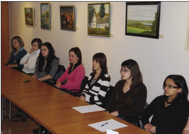
Na prvo srečanje je iz Porabja prišlo deset dejkeu, študentke, srednješolke pa takšne tö, štere že delajo