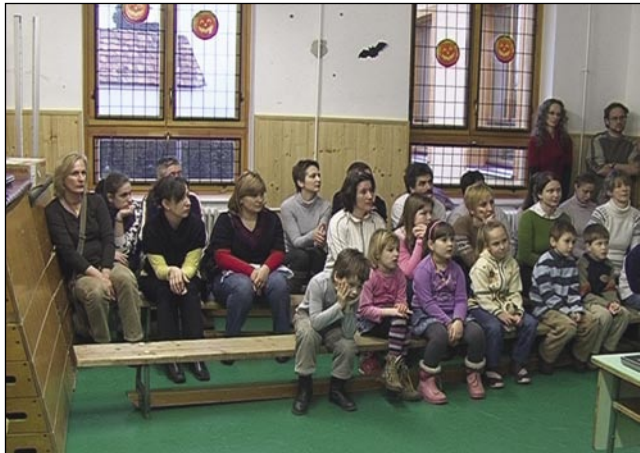
Starši bodočih prvošolčkov pri uri

imajo zelo radi. Upamo, da bo tudi naprej delala tako aktivno. Od leta 2007 poteka v naši šoli dvojezični pouk. To pomeni, da imajo učenci tedensko pet ur slo-