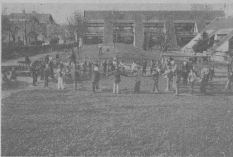
35 LET VVO CICIBAN