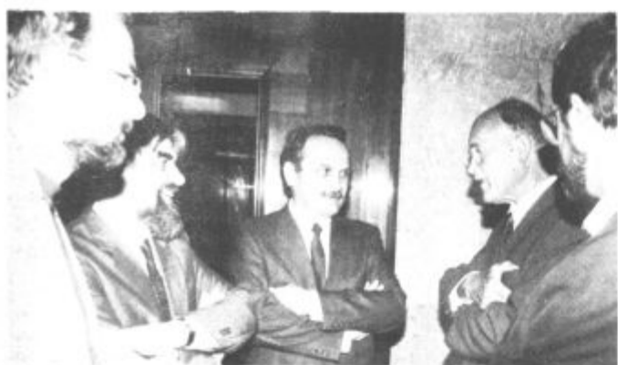
Zbrana družba: »Kdor se zadnji smeje, se...«