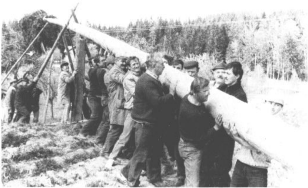
Mladinski mešani pevski zbor Centra srednjih šol