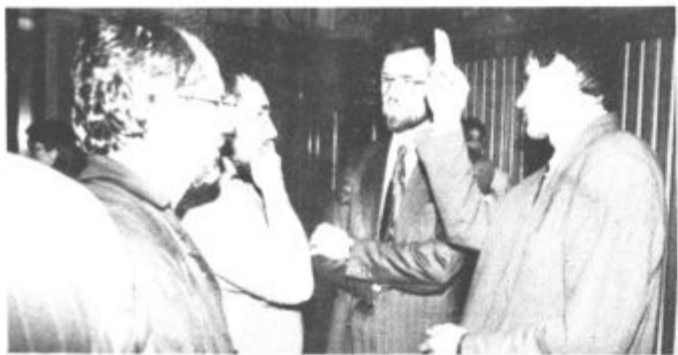
Janez Janša: »Bog nam lahko pomaga«