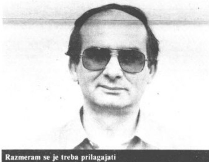
Razmeram se je treba prilagajati

»Res se je pri nas precej spremenilo, še vedno pa so težave s pridobivanjem denarja za inovacije. Denar za naložbe še dobiš, tako sem za dokončanje proizvodne dvorane za Torije dobil razvojni dinar, tudi proizvodnjo za trg financira LB Splošna banka Velenje, težje pa je pri financiranju inovacij. Banke pri