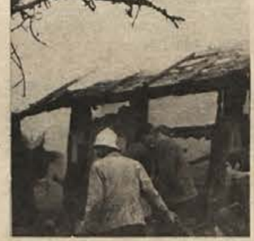
Premalo skrbi za dimnike - zato pa več požarov

Ljubljansko dimnikarsko podjetje mora do konca septembra povečati število dimnikarjev v novomeškem okolišču ter do istega roka pripraviti načrt opravljanja dimnikarskih storitev v okoliščih Novo mesto in Trebnje. Taka sta sklepa, ki so ju zapisali predstavniki občinskih skupščin Novo mesto in Metlika ter predstavniki ljubljanskega podjetja.