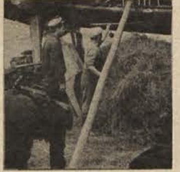
Kmetje bi vzeli posojila, če bi...

Podarjenemu konju sicer ne gre gledati pod zobe, kot pravi pregovor, če pa že gre za posojila, ki jih je treba vračati, pa izreku menda ne bomo storili sile, če to vseeno stori. V vsebinski občini so letos napeli mnogo moči, da bi zagotovili posojilo za razvoj zasebnih kmetij. Obrnili so se tudi na delovne organizacije. Trije kolektivi so doslej prispevali za posojila 450.000 dinarjev. Pri banki so dobili 711 tisočakov, sevniška hranilno-posojilna služba za kmete pa je prispevala 611 tisočakov. Ob tem pa se je vredno zamisliti nad prispevkom republike: borih 150 tisočakov! Čeprav le tri, so se domača podjetja v primerjavi z državo