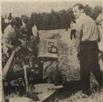
Preizkus znanja v traktorskem oranju

Podobno tekmovanje, kot je bilo pri Crnomlju, bo prihodno nedeljo, 12. avgusta, na posestvu kmetijske sosa Grm v Pogancih. Tekmovanja, ki imajo velik propagandni pomen za napredek kmetijstva, prirejajo društva kmetijskih inženirjev in tehnikov skupaj s kmetijskimi delovnimi organizacijami.