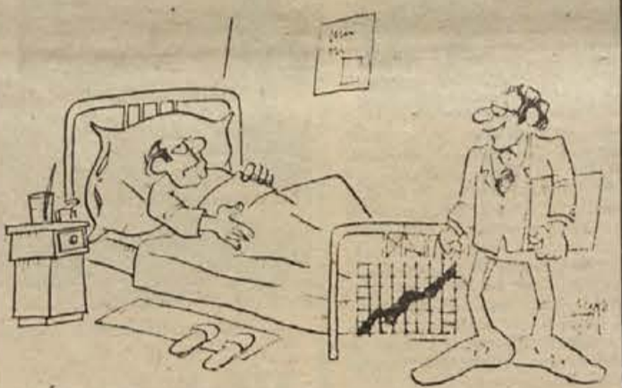
– Po diagramu sodeč vam gre tukaj bolje kot v podjetju, tovariš direktor!