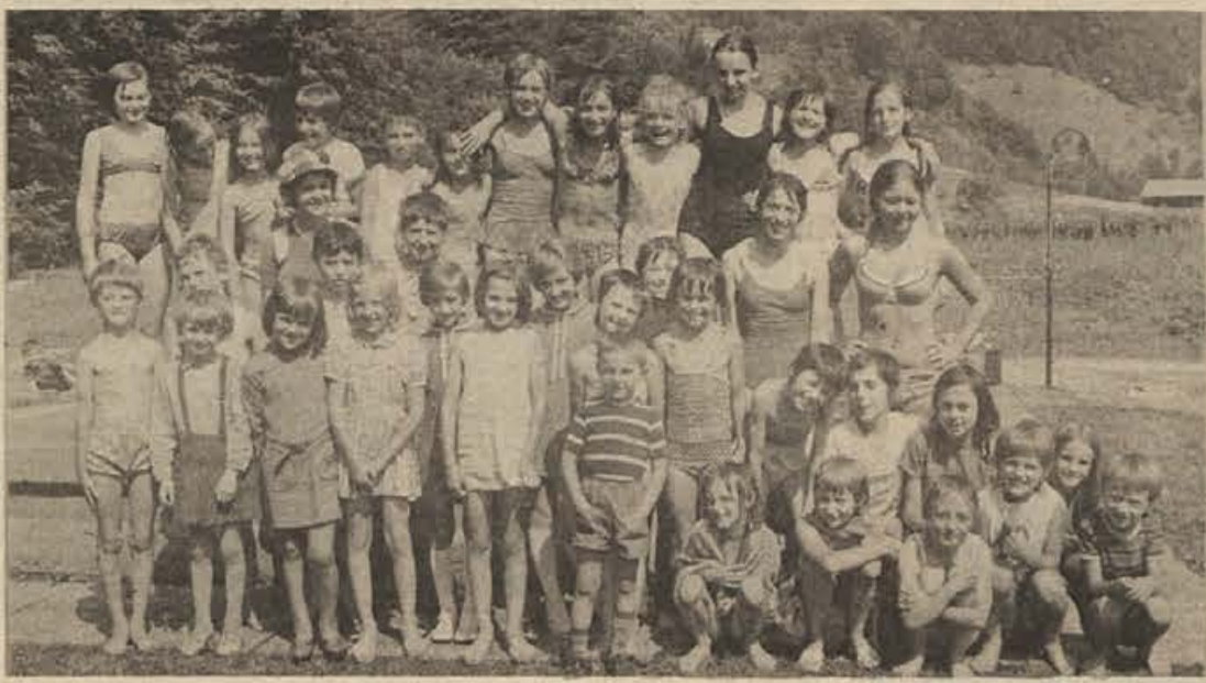
Skupina otrok, ki se je pred kratkim vrnila z Vranskega, se najlepše zahvaljuje RK iz Novega mesta, ki jim je omogočil bivanje na gorskem zraku.