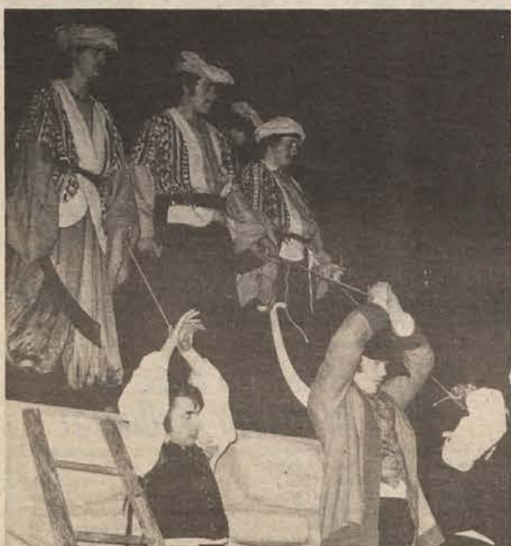
Hrabre branilce koroške zemlje so ujeli turški janičarji in jih privezane zasmehovali ob cerkvenem zidu v Svatnah, na prizorišču ljudske igre „Miklova Zala“

Prireditev, ki je bila velikega manifestativnega pomena, je pokazala kaj zmorejo koroški Slovenci, združeni v enotni organizaciji. Prav gotovo bi delo poklicni igralci zaigrali bolje, vendar ob tem zgodovinskem trenutku ni nihče razmišljal o posebnih umetniških kvalitetah, čeprav jih tudi ni manjkalo. Pomembnejša je bila izpoved ljudi, izpoved puntarske misli, ki še vedno živi. Igra je simbolizirala ljubezen Ko-