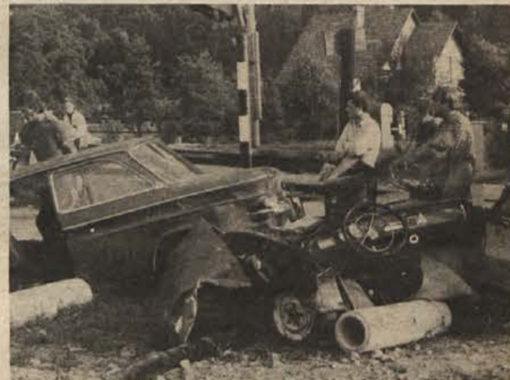
Preklana pločevina: opozorilo za druge.

VI. Tabor slovenskih likovnih samorastnikov, na katerem bodo letos sodelovali tudi ustvarjalci iz drugih republik in iz zamejstva, se bo začel danes s slovesno otvoritvijo tabora in tovariškim srečanjem na Brezovici nad Mokronogom. Udeleženci bodo ustvarjali do sobote, 18. avgusta, ko bodo ob 19. uri v avli osnovne šole v Trebnjem tabor slovesno zaključili in slikarjem ter kiparjem podelili plakete.