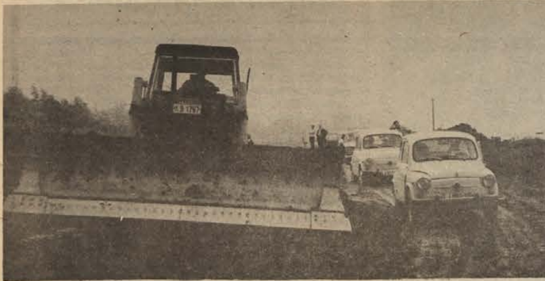
Dela za posodobljanje ceste Livold-Brod na Kolpi na območju Vasi-Fare hitro napredujejo, čeprav dela ovira močvirno zemljišče. Iz zanesljivih virov smo zvedeli, da letos prvega odseka ne bodo asfaltirali, ker bodo počakali, da se bo zemljišče „usedlo“. To pomeni, da potem cesta ne bo valovita ali celo razpokana.