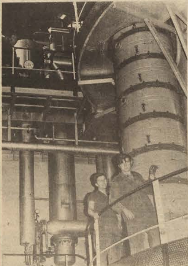
Nekdanji Jugotanin, veteran sevniske industrije, išče svoje poti k napredku...