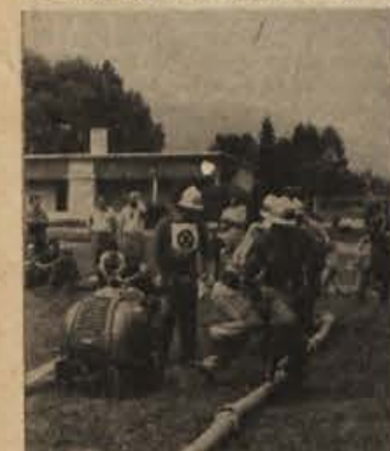
Taktično vajo izvajajo gasilski podčastniki, ki so pozimi končali teoretični tečaj.

Zamisel o toplarni pa bo uspela le, če bo zadeva zastavljena res strokovno. To pomeni, da ne sme biti prevelikih izgub toplote na poti od toplarne do stanovanj. Tudi znotraj posameznih stanovanjskih blokov mora biti ogrevanje urejeno tako, da bodo vsa stanovanja približno enako ogrevana. Zdaj se dogaja, da je v enih stanovanjih vedno premrzlo, v drugih pa prevroče. J. PRIMC