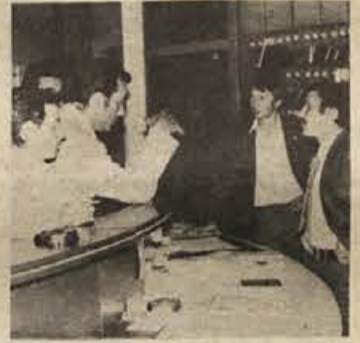
V recepciji garni hotela na Otočcu te dni

Dopustniški čas je na vrhuncu. Reke turistov ne puščajo Dolenjske ob strani, ampak se tudi ustavljajo. To kažejo podatki o turističnem prometu, ki jih zbirajo pri Dolenjski turistični zvezi v Novem mestu. Na voljo so sicer le številke o družbenih turističnih organizacijah, ne pa tudi o zasebnih. Turistične suše, značilne za predsezono, ko se je močno znižalo število domačih gostov, tuji pa so bili redkost, v sezoni ni več.