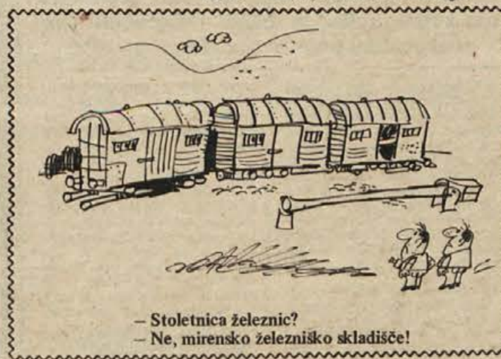
— Stoletnica železnice? — Ne, mirensko železniško skladišče!