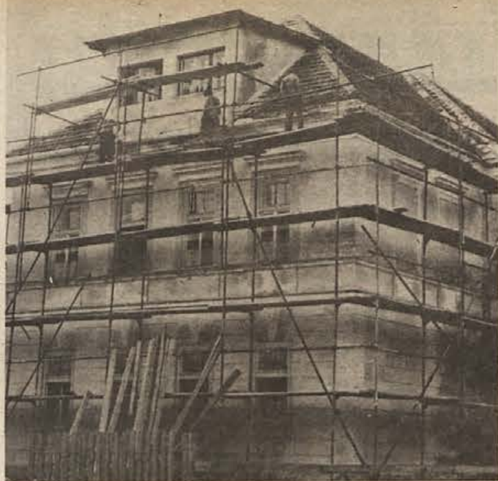
Osnovno šolo v Cerkljah obnavljajo. Preurejena bo do novega šolskega leta. Do takrat bo vseljiv tudi novo dozdani trakt s kuhinjo, jedilnico, vrtcem in učilnicami za nižje razrede.