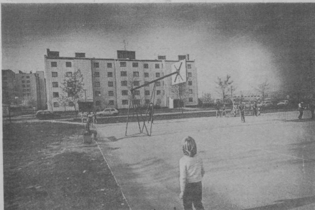
Večnamenska ploščad v stanovanjskem naselju ob Celovelandski v Novih Jaršah