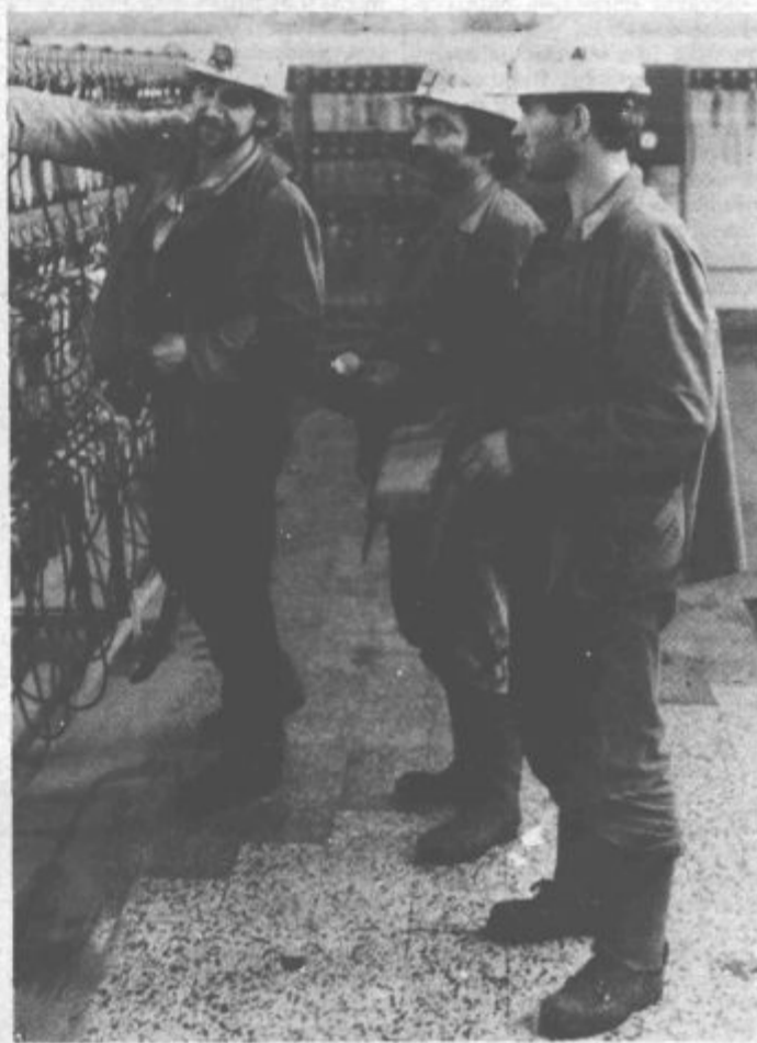
Kljub napornemu delu veselih obrazov (vos)

Tudi zadnjo nedeljo so bili velenjski rudarji v jamah, tokrat na udarniški akciji. Nakopali so kar 6 tisoč 800 ton lignita, ves izkupiček pa bodo namenili za potrebe celjske in slovenjgraške bolnišnice. Nedeljska akcija rudarjev je vsekakor presegla vsa pričakovanja. Načrtovali so namreč, da bodo rudarji no-