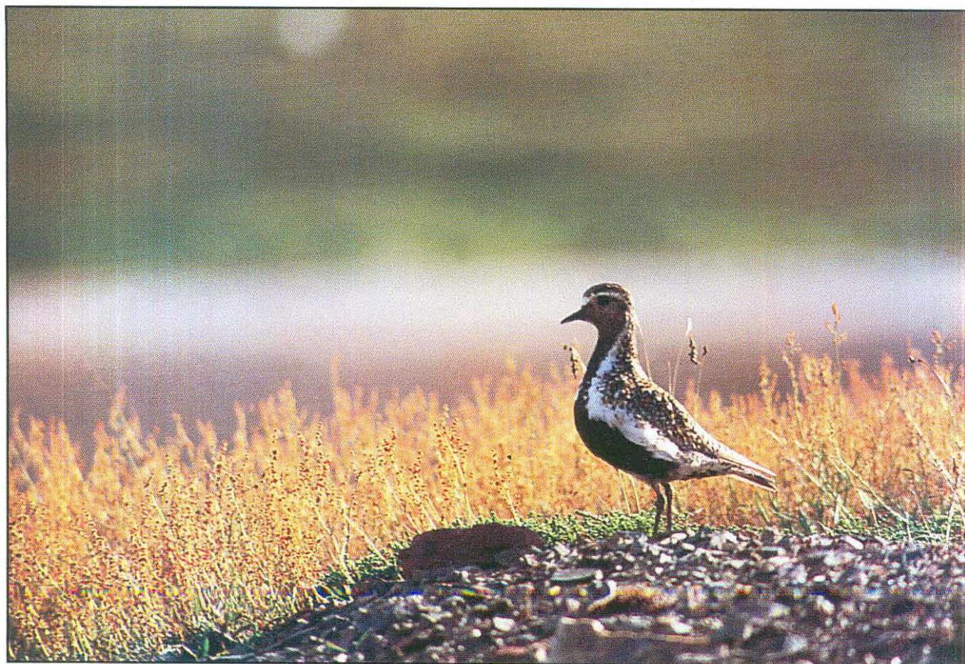
Zlata prosenka Pluvialis aprinaria , Grey Plover (Tomaž Mihelič)