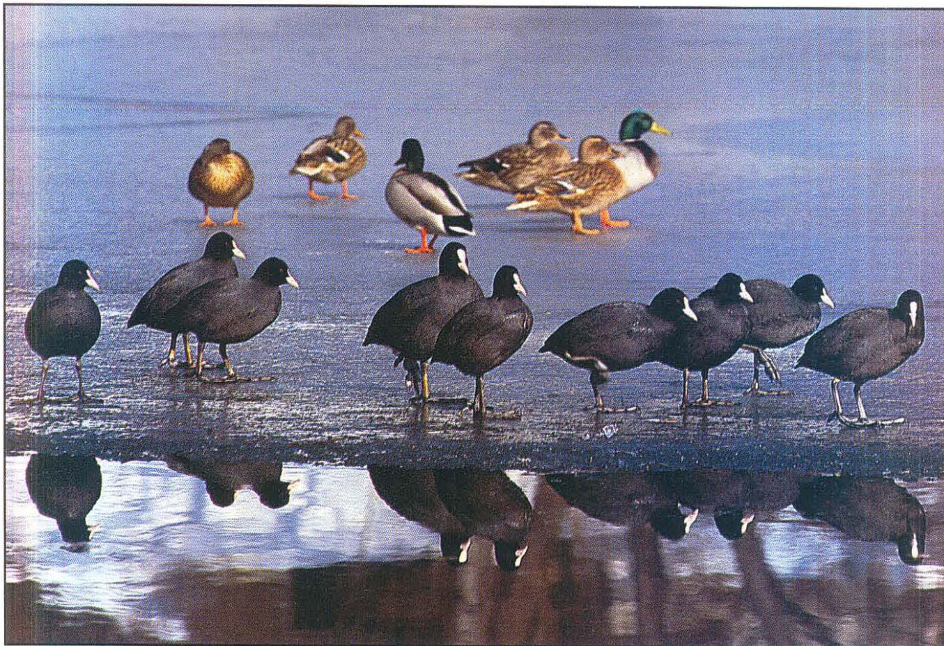
Črne liske Fulica atra , Common Coots, mlakarice Anas platyrhynchos (Hrvoje Oršanič)