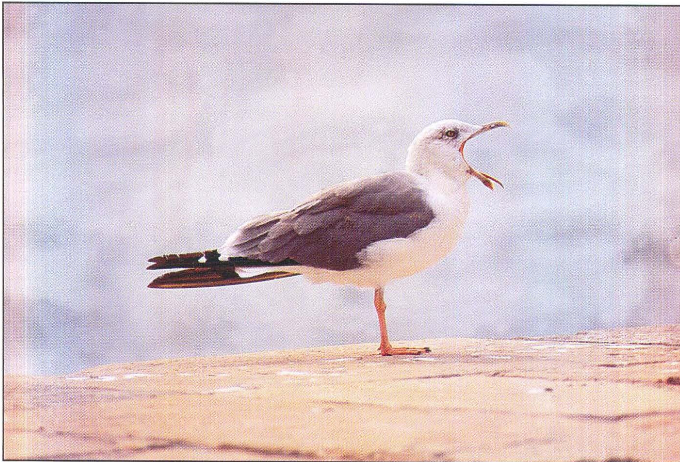
Rumenonogi galeb Larus cachinnans , Yellow - legged Gull (Borut Rubinič)