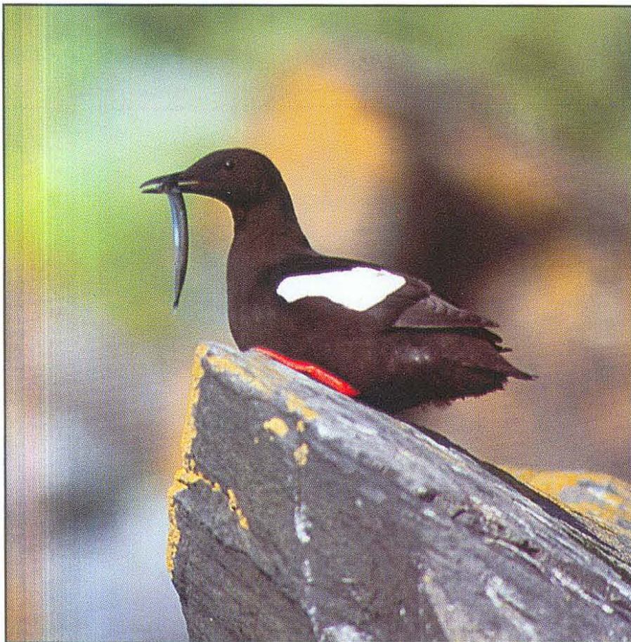
Črna njorka Cephus grylle , Black Guillemot (Tomaž Mihelič)