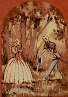
Princ s čopkom