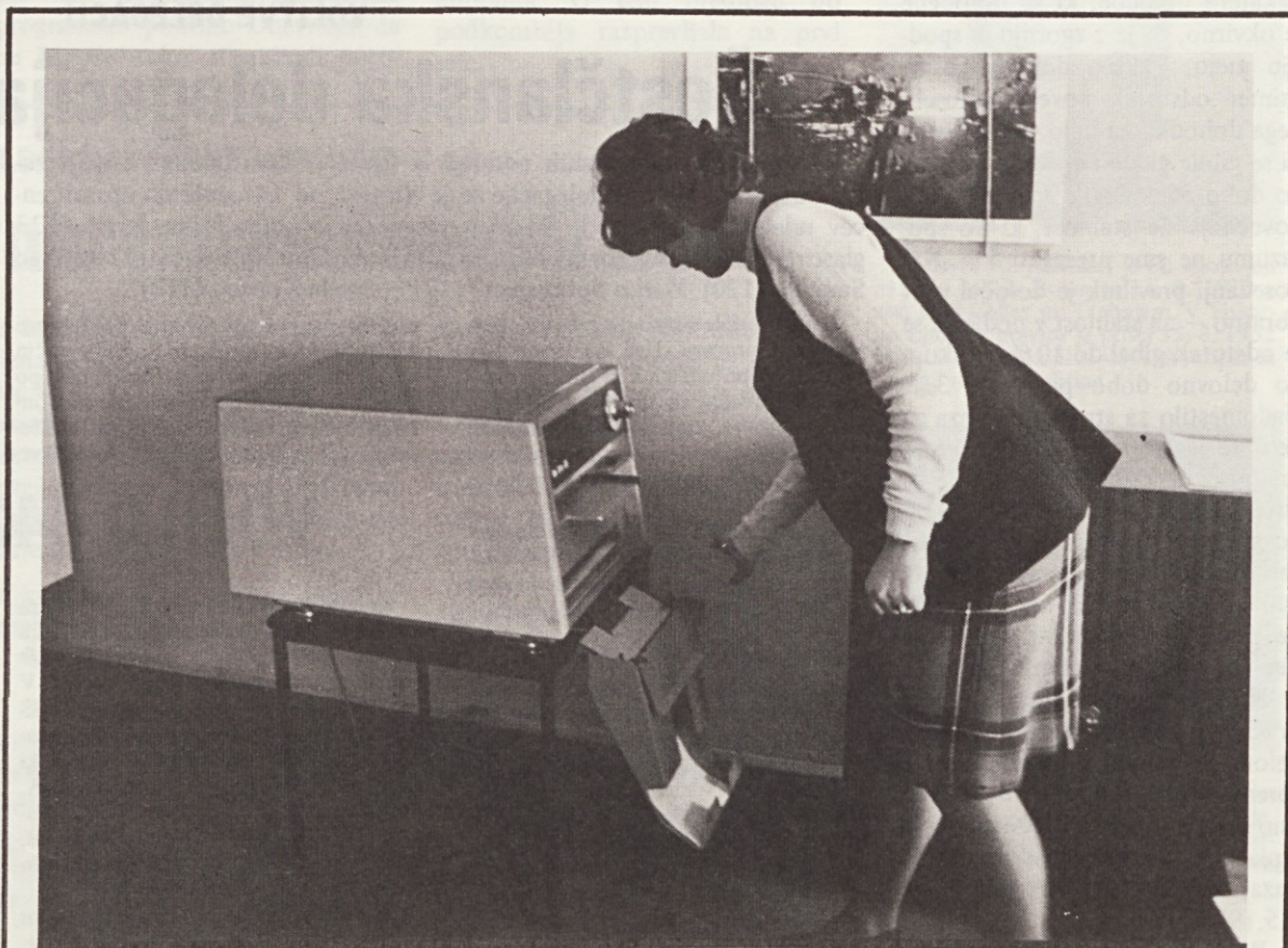
Ob koncu meseca marca je končno prispel fotokopirni stroj Rank Xerox 660, katerega smo težko pričakovali. Skupna investicija TOZD Ljudske pravice in TOZD Ljubljanskega dnevnika znaša 1437,57 Lstg oziroma s carino v dinarjih 65.000 din. Fotokopirni stroj je montiran v prostorih skupnih služb, v sobi 92/V 1 in ga bosta obe temeljni organizaciji uporabljali za svoje potrebe.

Za leto 1974 je planirana višina bruto osebnega dohodka za opravljeno normo izdelavno uro prikazana v tabeli 1.