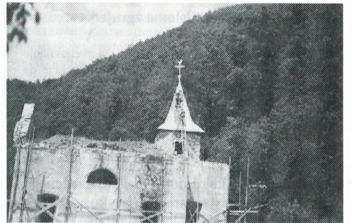
Cerkev pred pričetkom 1. faze adaptacije