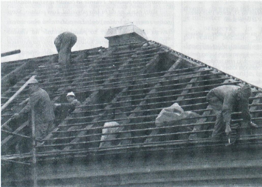
Knjižnica je dobila novo streho