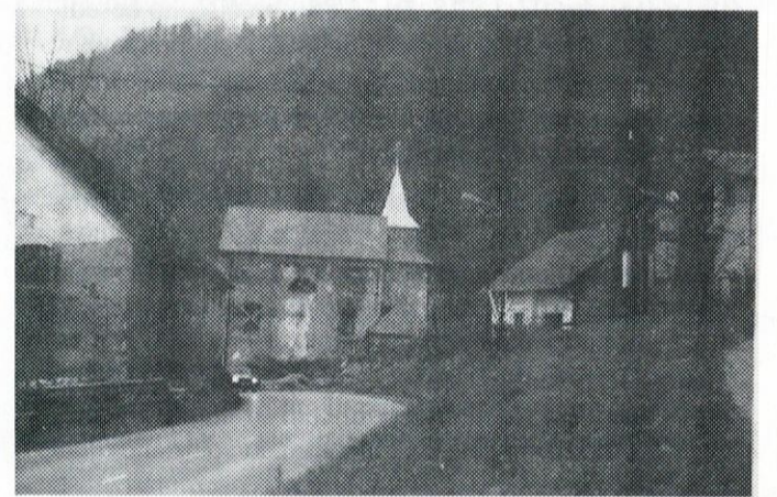
Cerkev po končanju 1. faze adaptacije