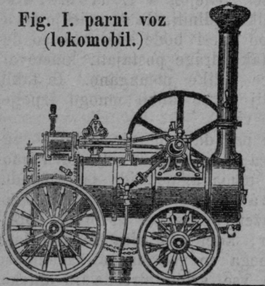
Fig. I. parni voz (lokomobil.)