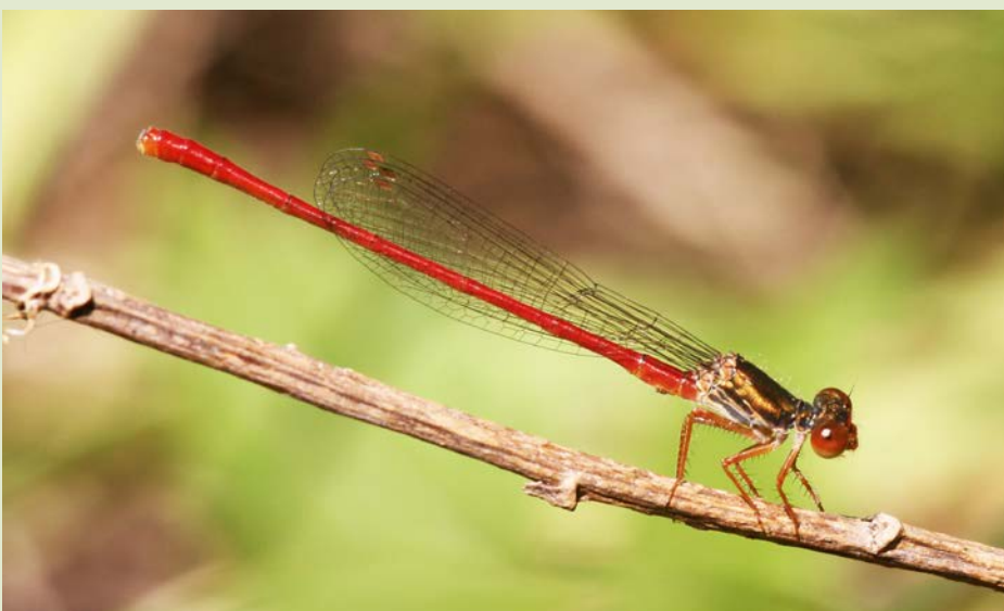
Skrb pred morebitnim izginotjem je prisotna še za nekatere vrste kačjih pastirjev, katerih številčnost se zmanjšuje ali pa so njihove populacije zelo ogrožene. Rdeči voščenelec ( Ceriagrion tenellum ), v Sloveniji zavarovana vrsta, ima svoje populacije v Slovenski Istri in v Vipavski dolini. Na prostovoljskih aktivnostih članov Slovenskega odonatološkega društva ga sicer še srečujemo, vendar se pri nas zanj ne izvaja noben naravovarstveni ukrep, zato je bojazen pred njegovim izumrtjem razmeroma velika. V podatkovni zbirki Zavoda za varstvo narave se zanj najde le en podatek iz leta 2006.