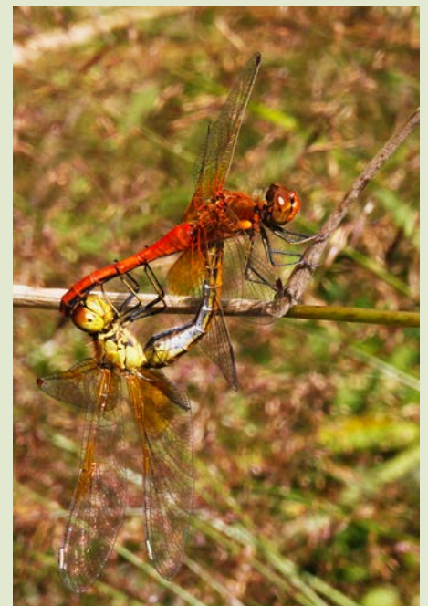
Za rumenega kamenjaka ( Sympetrum flaveolum ) je značilen velik rumeno-oranžen madež na bazi kril. Več vrst kačjih pastirjev je v Sloveniji znanih le še s peščice vod na omejenem območju države, rumenega kamenjaka pa smo pri nas nazadnje popisali leta 2014.