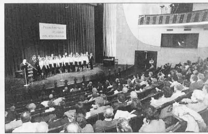
Arhivski posnetek lanske revije ZCPZ

V nedeljo, 26. novembra, se bo v Kulturnem domu v Trstu s pričetkom ob 16. uri odvijala jubilejna 30. revija pevkinih zborov, ki jo prireja Zveza cerkvenih pevkinih zborov iz Trsta. Na njej bo nastopilo 17 zborov iz tržaške pokrajine, med katerimi gre omeniti tudi bolj znane sestave, kot npr. Jacobus Gallus in Resonet , in zbere, ki se po nekajletni odsotnosti pomlajeni vračajo na revijo (npr. zbor iz Škedenja). Tudi tokrat bosta nastopila mladinskaskupina Opčin in skupina Shalom , ki sta s svojima krstnima nastopoma lani in