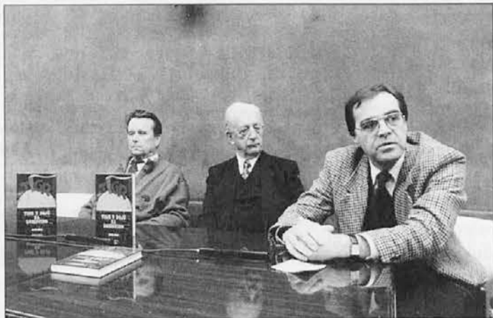
Pogled na predavateljsko mizo