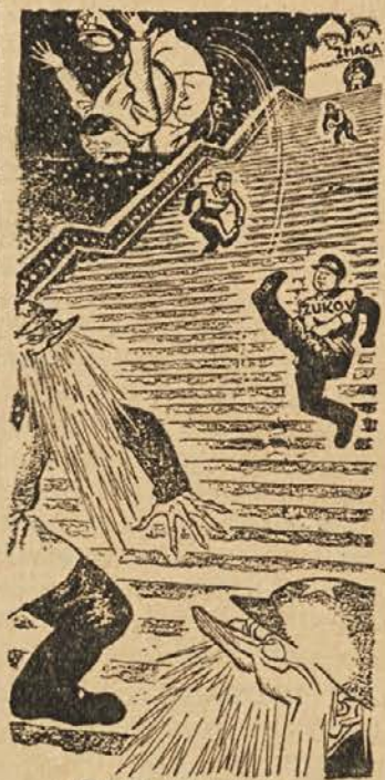
BRCA ZA BRCO