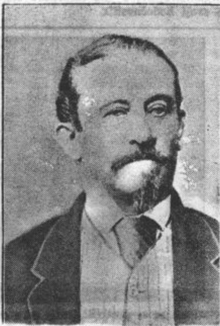
Fran Levstik o narodnem edinstvu l. 1867.

S temi par sestanki sem torej dobil tako prepotrebne lekcije, da trdno upam, da se mi odslej v moji grešni duši ne bodo več porajala taka in podobna nizkotna nagnenja. V tem me bo podpiral tudi ponovni dokaz, da plemenita nagnenja — vsaj v kmetski pari — še žive...!