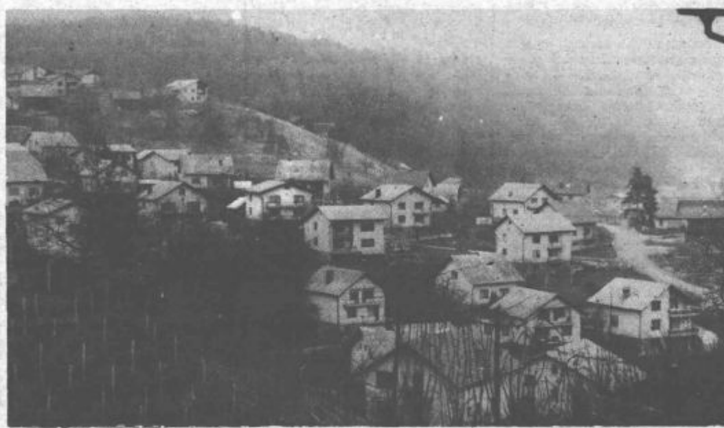
V programu četrtega samoprispevka so zapisane potrebe krajanov vseh zaselkov krajevne skupnosti Konovo. Največ pa jih imajo tudi ti na komunalnem področju

Prav v teh dneh se priključujejo na mestni toplovod še zadnja gospodinjstva v tej krajevni skupnosti. Izgradnja vročevoda je bila prednostna naloga tretjega referendumskega obdobja. Na nedavnem zboru krajanov moram pohvaliti Konovčane, saj so se zboru mnogi udeležili, so ocenili naše dosedanje delo. Ugotovili smo, da je iztekajoči samoprispevek dal željene rezultate. Gotovo je k temu precej prispevala pripravljenost krajanov. Pogovorili smo