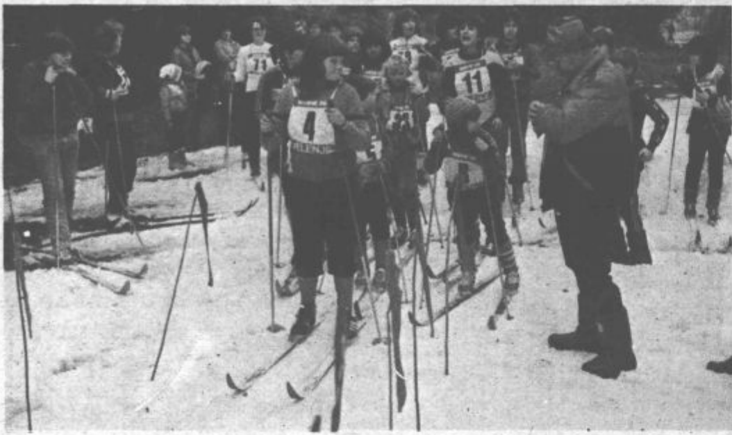
Le malokdo je verjel, da je sredi gozda ostala bela lisa snega, ki je omogočil tretji beli tek v počastitev mednarodnega praznika žensk