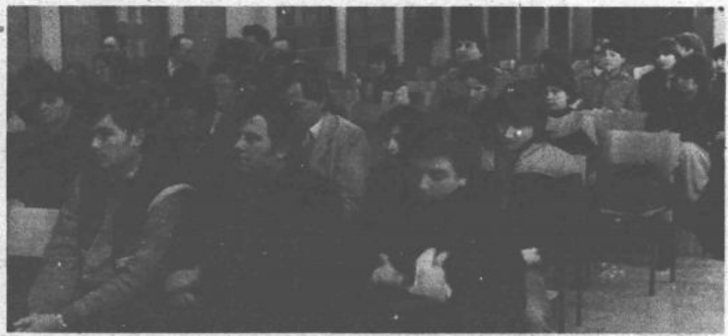
Večina učencev in staršev se je informativnega dne udeležila v dopoldanskih urah, nekateri pa so se z možnostmi nadaljnega izobraževanja seznanili popoldan.

Javna radijska oddaja v domu kulture v Titovem Velenju bo v sredo, 20. marca, s pričetkom ob 19.30.