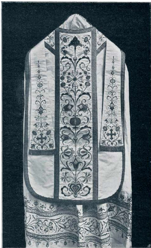
MAŠNA OBLEKA S SLOVANSKIMI ORNAMENTI

Zanimiv je tudi paralelni razvoj v načinu izobraževanja: Delu v cerkvi sledi delo izven cerkve, po društvih in na njihovih prireditvah zabavno-poučne vsebine. Potreba sili k večjim shodom v društvenem okviru in izven njega. Utrditi, okrepiti je treba obstoječe organizacije, navdušiti in vzgojiti ljudi za novo intenzivnejše delo z govori in pred-