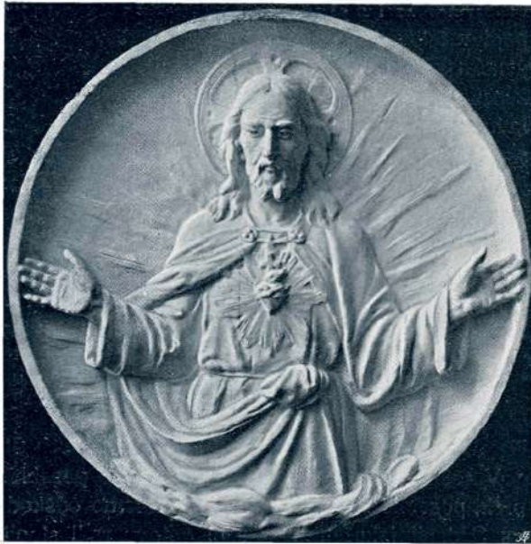
FR. ROPRET (RADOVLJICA) PRESVETO SRCE JEZUSOVO

filozofičnim tečajem v počitnicah na prelepem gorenskem Št. Joštu. Naraščajoče število priča, da prodira med dijaštvo zmisel za socialno in filozofično naobrazbo. Tudi med drugovrstnimi dijaki narašča zanimanje za ista vprašanja. Čudili bi se, če ne bi bilo častnega števila te vrste slušateljev, zlasti radi dejstva, da hrepeni vsak dijak po tem, da čuje najrazličnejše predmete v materinščini in v zmislu našega narodnega stališča. Tudi drugo slovensko dijaštvo bo rado prihajalo, da preštudira naš kulturni razvoj, ki nudi toliko zanimivih novosti. Saj smo v marsičem pred drugimi Slovani, vsaj kar se tiče lastne samotvorne sile. Zbliževanje med slovanskim dijaštvom je komaj v prvih početkih, zlasti velja to za slovensko