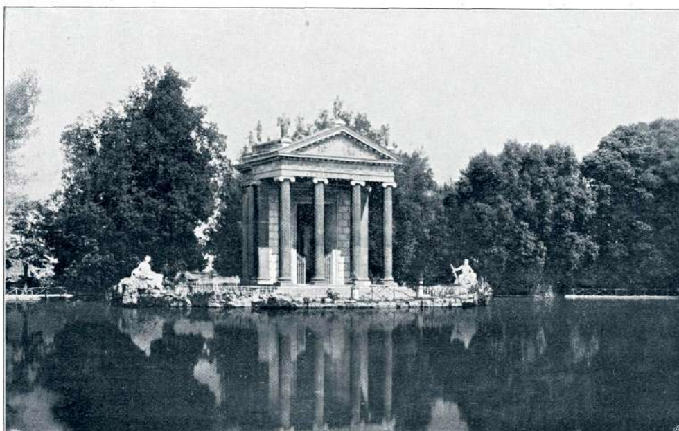
IZ PARKA „VILLA BORGHESE“ V RIMU