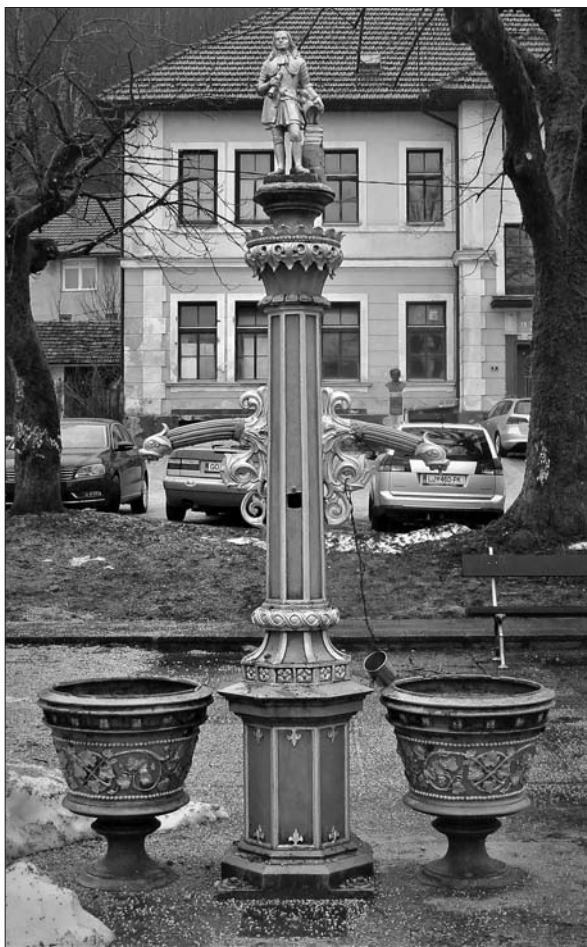
Višnja Gora, Valvasorjev vodnjak.

dvorski livarni. Tam sta poleg osrednjega stebrnega dela nameščena še litoželezna zbiralnika za vodo v obliki vaz (nem. Brunnenstock /pl. Brunnenstöcke , Brunnenschalen ). Mimogrede, osem identičnih vaz, na osrednjem delu čaše okrašenih s trtnimi listi in viticami med punciranima trakovima, vidimo tudi pred stopniščem dvorca Podturn (današnji Tivolski grad) v mestnem parku Tivoli v Ljubljani. Tam je kratek čas živel feldmaršal Jožef Vencelj Radetzky, ki je dal grad obnoviti in preurediti park – takrat so pred stopniščem postavili litoželezne vaze. Bile naj bi uvožene, 12 vendar je glede na to, da so enake tistima ob višnjegorskem Valvasorjevem vodnjaku, jasno, da so bile izdelane v Auerspergovli livarni na Dvoru. S to plemiško družino pa je bil ne nazadnje Radetzky po ženini strani tudi v sorodu. 13 Osrednji del vodnjakov v Idriji in Višnji Gori je zasnovan v obliki stebra (nem. Brunnenständer , Druckständer ), in sicer osemkotnega, s pipami (nem. Ausläufen , Auslaufrohren ).