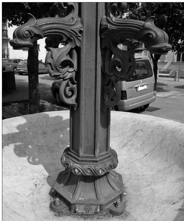
Idrija, t. i. Korletov vodnjak, izrez.