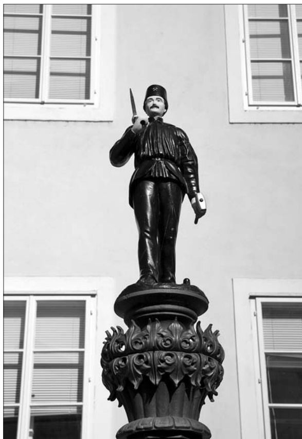
Idrija, t. i. Korletov vodnjak, izrez z rudarjem.