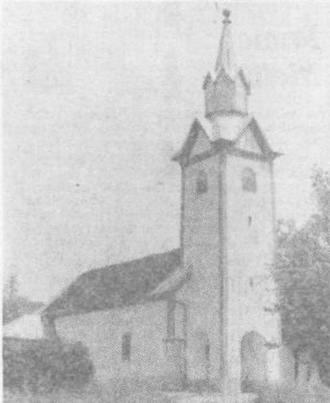
Obnovljena cerkva Sv. Jakoba – arhitektonski dragulj sredi starega in novega