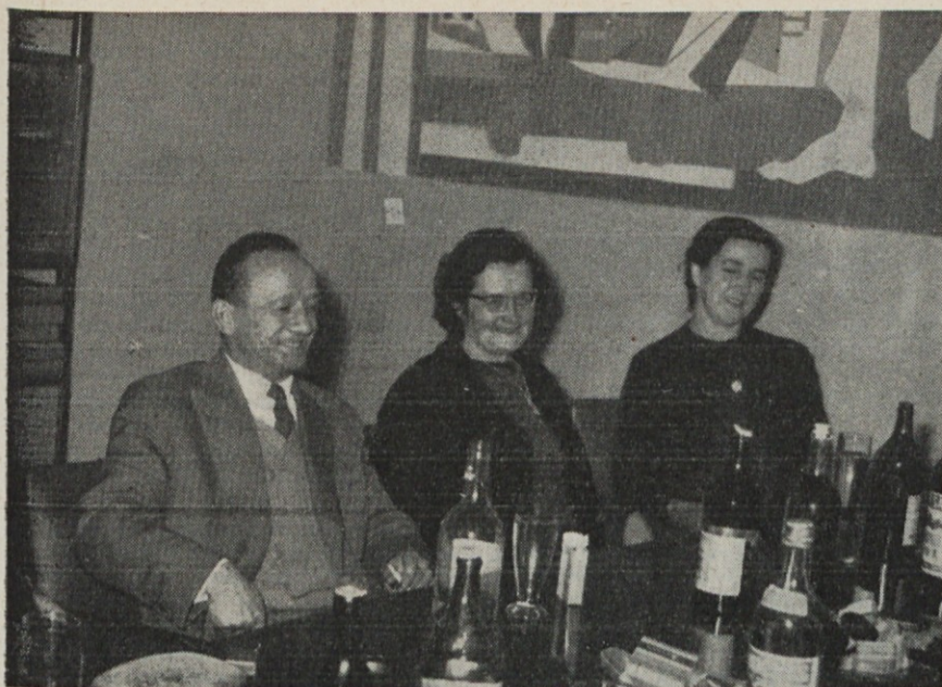
Nekdanji sodelavci — sedaj upokojenci — na poslovnem sprejemu pri direktorju

Blejčeva, do nedavnega delavka v motovilnici je rekla, da je to 8. marec, dan žena. Na ta dan se zbero žene in se vedno lepo in o mnogobnem pogovorijo. Tudi praznovanje, ki je samo njim namenjeno, daje povod, da se je odločila za ta praznik.