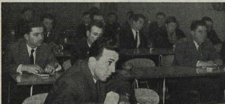
Občni zbor strelskega društva v Jaršah

Pred vami, mladimi ljudmi pa je od-prta pesem bodočnosti ali bolje – popoln zakon – boljši, iskrenejši, srečnejši, z velikim izgledom, da bodo na svet pr-hajali samo zaželeni otroci.»