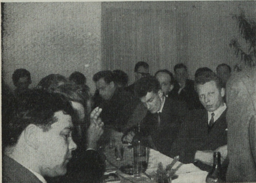
Člani delavskega sveta na seji v Predvoru

Ze dalj časa govorimo o nalogah, ki naj omogočijo podjetju boljše gospodarjenje, je poudaril direktor. Rezultat teh