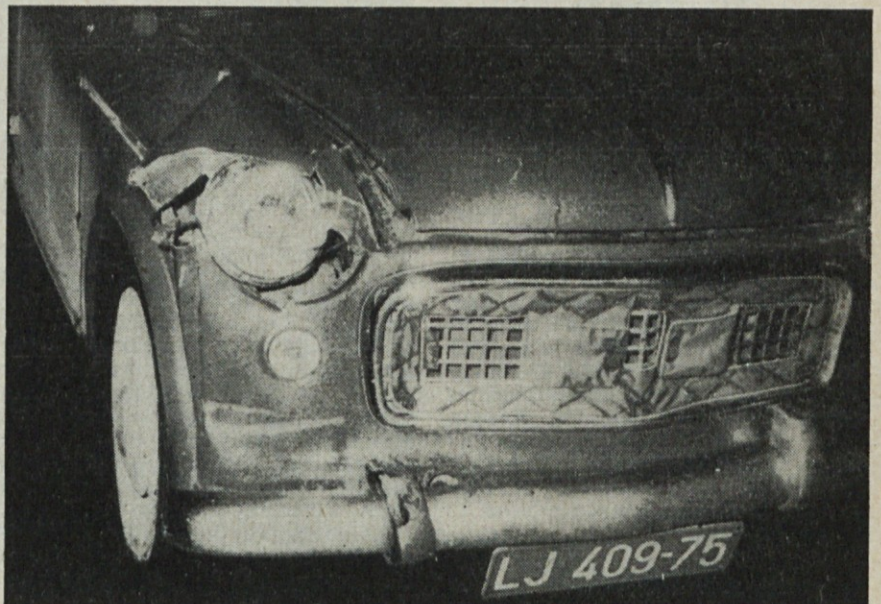
Naš službeni avto, po lažji prometni nesreči februarja letos

Zaključno so sklenili k tej točki, da se ugotovljeni manjko v znesku 1 926 022 din (starih) knjiži v breme izrednih izdatkov.