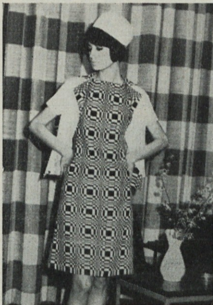
Obleka iz op-art desena, kakor smo jo predstavili na reviji Moda 66

Ljubiteljem nogometne igre se zato reje obeta vkljub »domačim težavam« bogat spored televizijskih prenosov, ko se bodo pomerili za najvišje naslove najboljši, kamor tokrat jugoslovani ne sodimo.