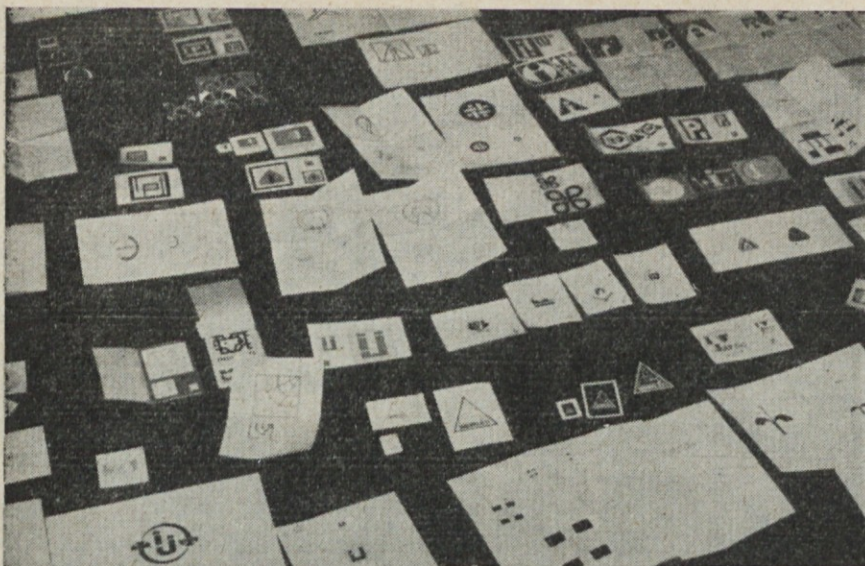
Predlogov za nov zaščitni znak Induplati je bilo 241. Del teh prikazuje ta slika