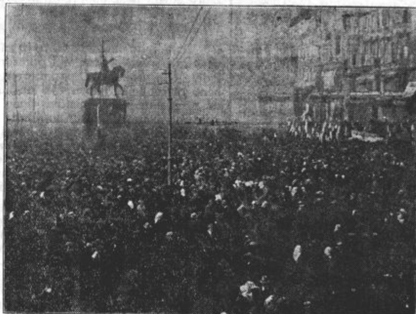
Jelačićev trg v Zagrebu.

Po 6. januarju prošlega leta je nastala nova doba v naši državi. Naša država se imenuje Jugoslavija. Izginile so one male, za življenje nesposobne oblasti. Naša država ima eno, slavno zastavo. Ta zastava pomeni našo nerazdeljivost, naše edinstvo, našo nepremagljivost, a obenem spoštovanje velike in častne prošlosti, zgodovine srbske, hrvatske in slovenske. Ona pomeni, da je vse pozitivno in vse dobro iz naše preteklosti in naše sedanjosti v velikem jugoslovanstvu, v katerem bomo pričakali srečne dni.