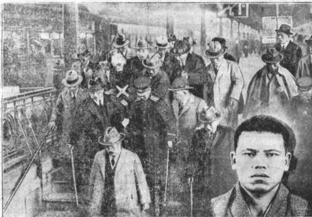
Napad na japonskega ministrskega predsednika Hamaguči-ja.

Modroce iz afrika, močno blago à Din 260.— žimnate modroce, peresnice, mreže, cvilih in žimo, posteljne odeje kupite najceneje pri RUDOLF SEVER-ju LJUBLJANA, MARIJIN TRG