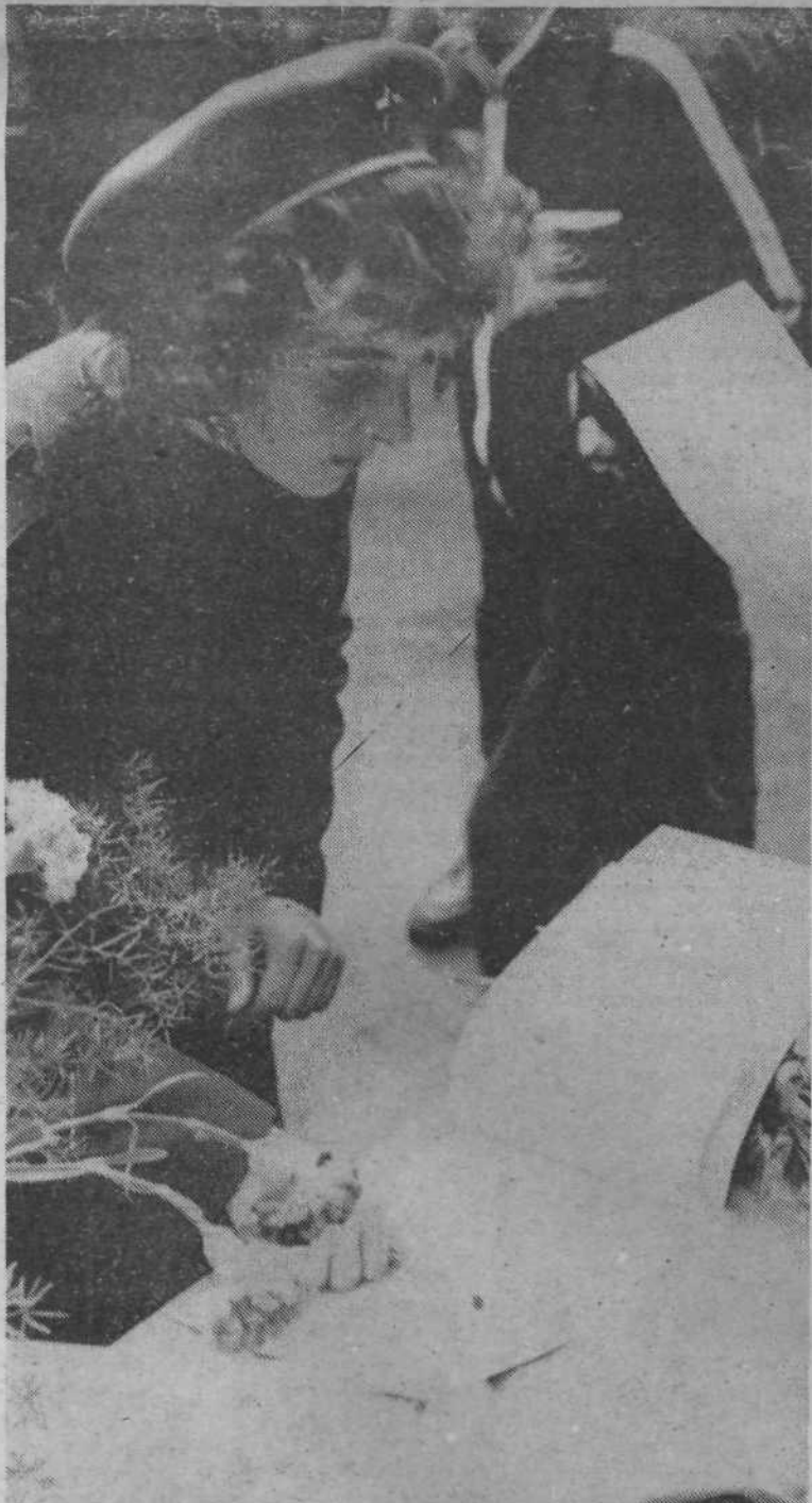
V vojašnici Josip Broz Tito na Poljanekih cestih je te dni zaprisegla nova generacija mladih vojakov. To pot so zaprisegle tudi ženske pripadnice JLA.

Pobudo za spremembo je dal občinski odbor ZZB NOV in predlagal, naj bi za praznik občine določili 21. junij. Tega dne so namreč ljubljanske žene množično demonstrirale proti okupatorjevemu nasilju. Demonstracije so bile leta 1943 in sicer 7., 15. in 28. februarja, 12. maja, 21. junija in 1. avgusta. To je bilo edinstveno dogajanje v okupirani Evropi. Glede na to, da so demonstracije potekale prav na območju občine Center, je vsekakor umestno, da zaslužijo obeležbo, kakršna je predvidena v osnutku odloka.