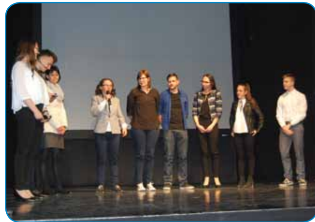
Na predstavitvi filma »Pet prijateljjev...« s soboškim gimnazijci