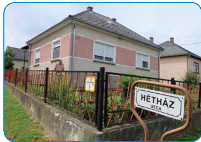
Družinska iža v Slovenski vesi

bilau, zato pa sem tam samo leto pa pau bejo pa sem nazaj v ciglence prejšo. V ciglencaj sem nej bejo nutzaprejtj, skrak je bilau, pa gda sem svojo delo tanapravo, te sem leko domau prejšo. Deset lejt sem tam delo, dapa naslejd-