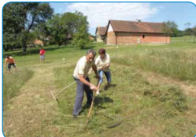
Košnja trave sodi v »železen repertoar« kmečkih iger, včasih, le nekaj desetletij nazaj, je spadala med težja kmečka opravila; kosa je morala biti dobro »sklepana« (naostrena s kladivom), tudi kamen za brušenje v »voderju« (osla - za brušenje kose) je moral biti primeren. Prava dragocenost so bili tisti boljši

ne tehnike, od kombajnov za žetev do radijskih in televizijskih sprejemnikov. Slednji so iz kmečkih domov, rečeno nekoliko grobo, izrinali branje knjig najpogosteje iz zbirk Prešernove in Mohorjeve družbe ali sposojenih v vaških knjižnicah.