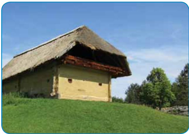
Z blatom namazana iža na dvoriški z lipo (2017)

23. septembra smo Slo- venci glavni organizatori 14. Sombotelskoga narod- nostnoga dneva, na šte- roga smo pozvali člane Drüštva porabski slovenski penzionistov, ka bi vküper svetili njino (lanjsko) 20. oblejtnico in 15. oblejtnico slovenske iže v Sombotelu. Iža je bila postavljena leta