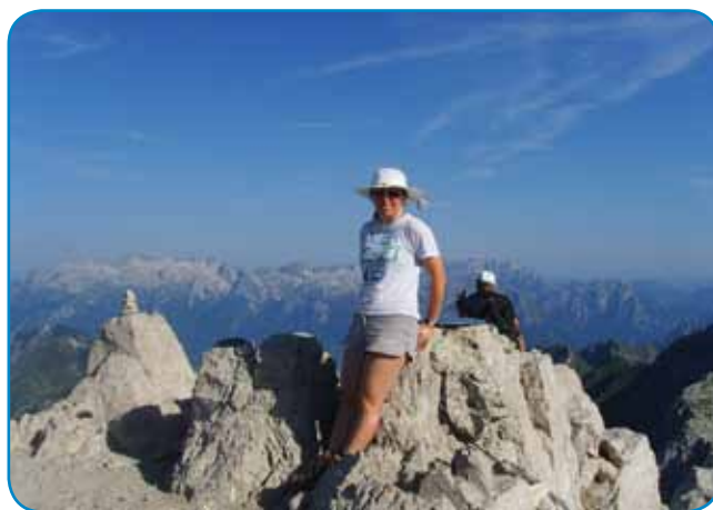
Lucija trno rada odi v hribe

Po konci študija je Prekmurka ostala v Ljubljani, vej pa tam tudi kak samozaposlena več dela dobi. Za kulturo se v Sloveniji v zadnji lejtaj, sploj po krizi, menje penez davle, zatau je nej léko preživeti, tudi zavolo toga je hvaležna Televiziji AS, ka so ji ponüdili delo pri projektu Pet prijateljjev na razpotju evropskega parlamenta. »Ges mam rada mer in tišino, samo zavolo dela zdaj v glavnom živém v Ljubljani. Nikdar pa se ne vej, kak de v prihodnosti, kama me pout zanese,« pravi mlada režiserka, stera že od malih naug rada odi v planine. »Škem prehoditi cejlo slovensko planinsko paut, stera se začne v Maribori in konča v Ankarani. Veuki tau sam že prehodila. Poletje je rezervirano za Julijske Alpe, pa za bole viske gore. Morem praviti, ka na Triglavi sam bila samo gnauk, tau pa zatau, ka je tam tak velka gužva, pa rajši odim tam, gé nega dosta lidi. Če deš