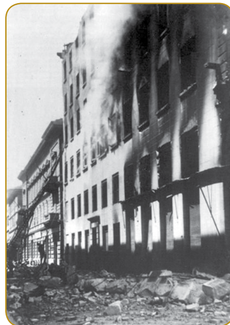
Gorvužganje Narodnoga doma v Trsti je grato simbol fašističnoga terora

vesnici Veržej so leta 1920 zozidali prvi maust, šteri je Slovensko krajino povezo z drügov slovenskov zemlauv. Nauvo grajnco je naprejspisala Trianonska mirovna pogodba, podpisana junüša 1920. Zvekšoga se je ta meja gordržala do gnes. Slovinci