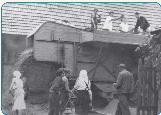
Zgodbe od nekdanj do - morda - nekoč stran 3