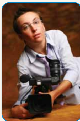
»Porabje ma rejsan dobre lidi« stran 6