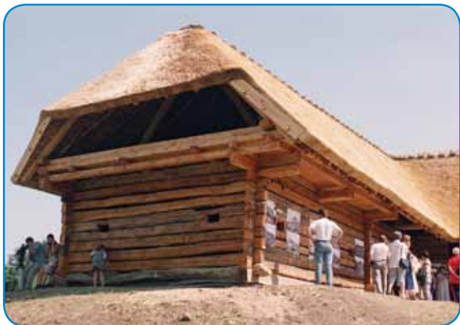
Spaudnji kusti (h)rast cimpra je eške iz stare iže (2002)

Pred 15. lejtami – 18. avgusta 2002 – je bilau v sombotelskom škanzeni 3. srečanje Porabski Sloven- cov, na štero je prišlo 300 lüdi. Na tom srečanju so