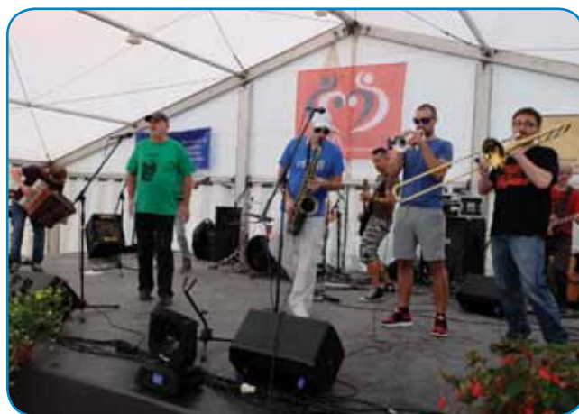
Ansambel Orlek je igro na Porabski dnevaj

»Če demo gorvzet nika nauvoga, te več probamo. Ovak ranč nej trbej, vej pa je vse kontinuerano. Mamosta 2-3 koncerte na mejsec, zdaj po Monoštri demo na Lent