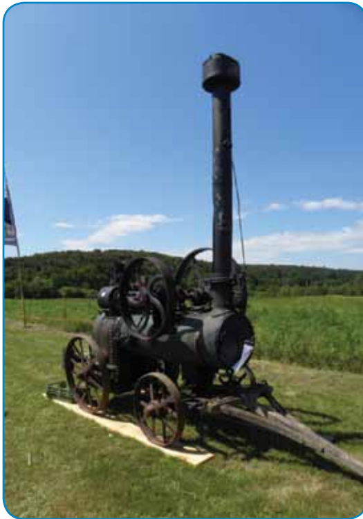
Lokomobila, ki jo je bilo potrebno s konjsko ali kravjo vprego vleči od soseda do soseda, kjer je (kot parni stroj) poganjala mlatilnico; otroke pa je pritegnila s piskanjem, ko je »mašinst« spustil paro skozi piščalko in opozoril, da se delo začinja

Prekmurje, Prlekija, Slovenske gorice pa tudi številni drugi kraji v Sloveniji pripravljajo dogodke, povezane z delom nekoč. Vsekakor smo lahko zadovoljni, tudi če gre za praznik česnje v Goriških brdih ali dan borovnic v kraju Borovnica ali kakršenkoli običaj. Seveda so novodobni dogodki bolj zaradi druženja, »starodobni« pa še zaradi ohranjanja kmečkih del in vsaj prenašanja duha le-teh na sedanjo generacijo »pametnih telefonov.« Ob druženju, ki ga je vedno manj, je pomembno tudi (vsaj) približevanje opravičilo nekoč, če popolne enakosti ni mogoče prenesti v sedanji čas. Nič ne