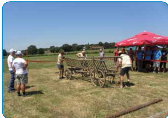
Tudi razstavljanje in sestavljanje kmečkega voza, običajno takega za prevoz sena, spada v program kmečkih iger

lepah, dovolj velikih snopov). Pogosto je sočasno z žetvijo prikazana peka kruha (mlačev in mletje pa izpuščena). Nedavno sem v daljši televizijski reportaži videl, kako se je gospodinja lotila peke kruha. Testo je mesila v plastični