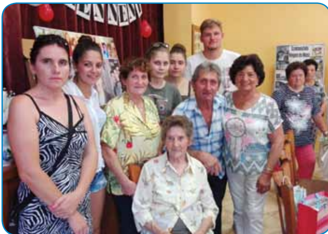
S člani ožje družine

kov. Županja Valerija Rogan ji je čestitala v imenu članov samouprave in ji je predala spo-