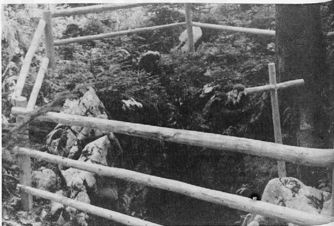
Tako je fotografska kamera posnela v soboto, 7. t.m., enega izmed štirih globokih brezen v Kočevskem Rogu, ki so bila prizorišče povojnega množičnega pobiranja. Ob robu brezna pred kratkim postavljena lesena ograja in križ