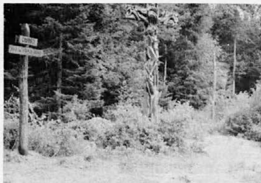
Skoraj šest metrov visok leseni križ, delo kiparja Metoda Frlica, ob stezi, ki vodi h grobišču pod Krenom v Kočevskem Rogu. Le nekaj desetim metrov od grobišča je bila 8. t.m. velika spravna prireditve

A vrnimo se k nalogam bodoče uprave. Rekel sem, da se Ssk zavzema za nadaljevanje politike razvoja in sožitja, kakršna