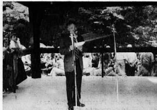
Predsednik slovenskega parlamenta govori izseljencem v Dolenjskih Toplicah

te osebne integritete je tudi narodna pripadnost. Nacionalna gibanja v vsej Vzhodni Evropi, posebno v Sovjetski zvezi, tedaj niso nekak recidiv v nacionalistično ideologijo preteklega stoletja, niso znak neke zaostalosti, kot to dostikrat v nerazumevanju pojmujejo na Zahodu, pač pa integralni del gibanja za svobodo, za resnično demokracijo, za lastno osvoboditev, ki mora biti