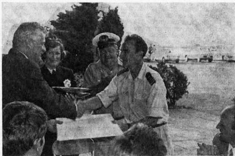
Tudi v miru skupaj — Predsednik občinske skupščine, poveljnik »Jadrana« in vodja ribolova