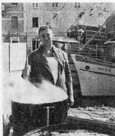
Žubori, žubori brodet