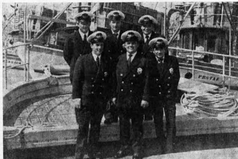
Posadka »Deklice« — najmanjša in najmlajša