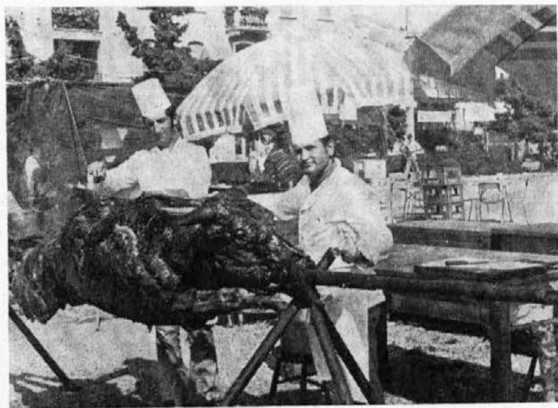
Vol se vrti...