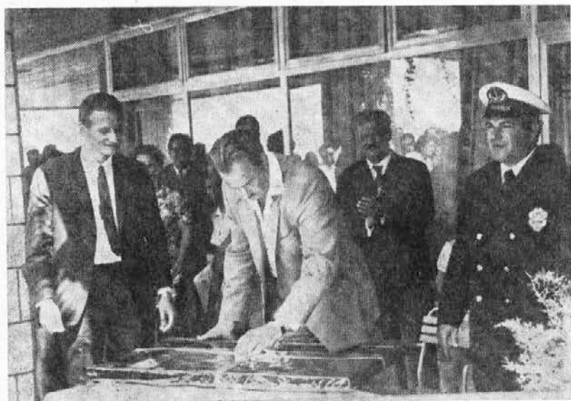
Ribiči niso pozabili glavnega direktorja

Popoldne so se ljudje porazgubili po domovih. Na ulice jih je zvečer izvabila muzika, ki se je slišala po vsem mestu. Sedaj se je