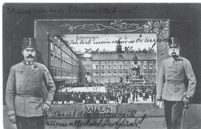
Franc Ferdinand in Franc Jožef.