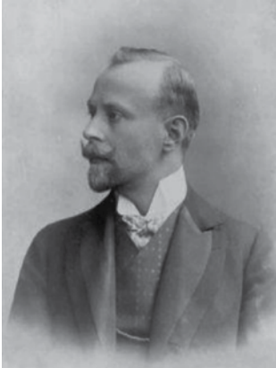
Ivan Žolger (1867–1925).