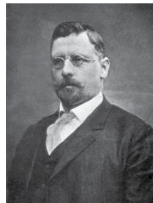
Ivan Šusteršič (1863–1925).