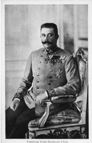
Nadvojvoda Franc Ferdinand d'Este.

dar sta glede trializma obstajali dve možnosti. Prva je želela zadostiti starim zahtevam Čehov po več enakopravnosti. Nastala bi avstro-ogrsko-češka država. Druga možnost je bila vključitev južnih Slovanov v trojedino državo. Po tem načrtu pa bi nastala avstro-ogrsko-jugoslovanska država. Vendar je treba poudariti, da navedena imena za preurejeno monarhijo nikoli niso prišla v poštev, saj je že poimenovanje avstro-ogrsko spominjalo na delitev monarhije. Že ti dve možnosti trialistične ureditve države kažeta na različna mnenja sodelavcev prestolonaslednika znotraj belvederskega kroga. Na kritičen odnos prestolonaslednika do vpliva Madžarov in krepitev nemškega nacionalizma je opozoril tudi Fran plemeniti Šuklje, ki je v svojih spominih o nazorih Franca Ferdinanda zapisal: »Saj je jasno uvideval, da pod vlado odrevenelega starca Franca Jožefa starodavna habsburška država kar drvi proti prepadu! Madjare je sovražil, istotako so mu bili zoprni nemški radikalci, ki so poleg svojih političnih izgrediv žalili njegovo živo katoliško prepričanje.« 19 Zgodovinske reformne načrte Franca Ferdinanda ocenjuje različno. Vendar pa velja poudariti, da se je prestolonaslednik zavedal moči sodobnih narodnopolitičnih gibanj za enakopravnost posameznih narodov habsburške monarhije. 20