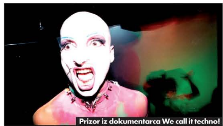
Prizor iz dokumentarca We call it technol

mi fleši evropskih alternativnih glasbenih scen, od Poljske in Belorusije do Nemčije in Bosne, prišla do izraza dokumenta o bendih, ki sta napovedala slovensko pomlad: Podgorškov zapis Laibachove turneje po ZDA leta 2004 Razdružene države Amerike in