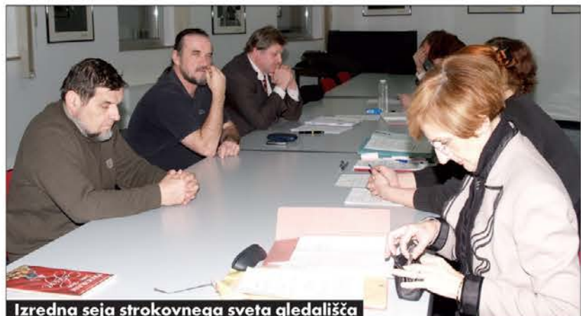
Izredna seja strokovnega sveta gledališča