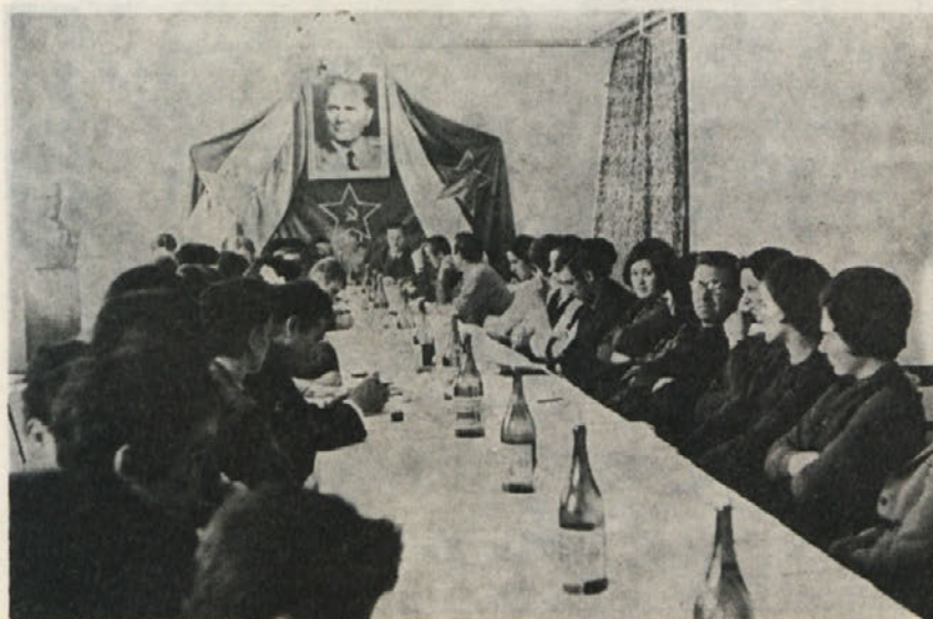
Slavnostna seja starega in novega DS

Vendar se nam je to upanje kmalu zrušilo. Ko je bil sklican v soboto, 25. aprila, zbor samouprav-