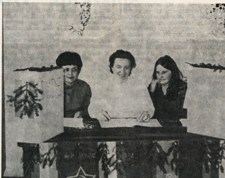
Volišče v Mirni peči