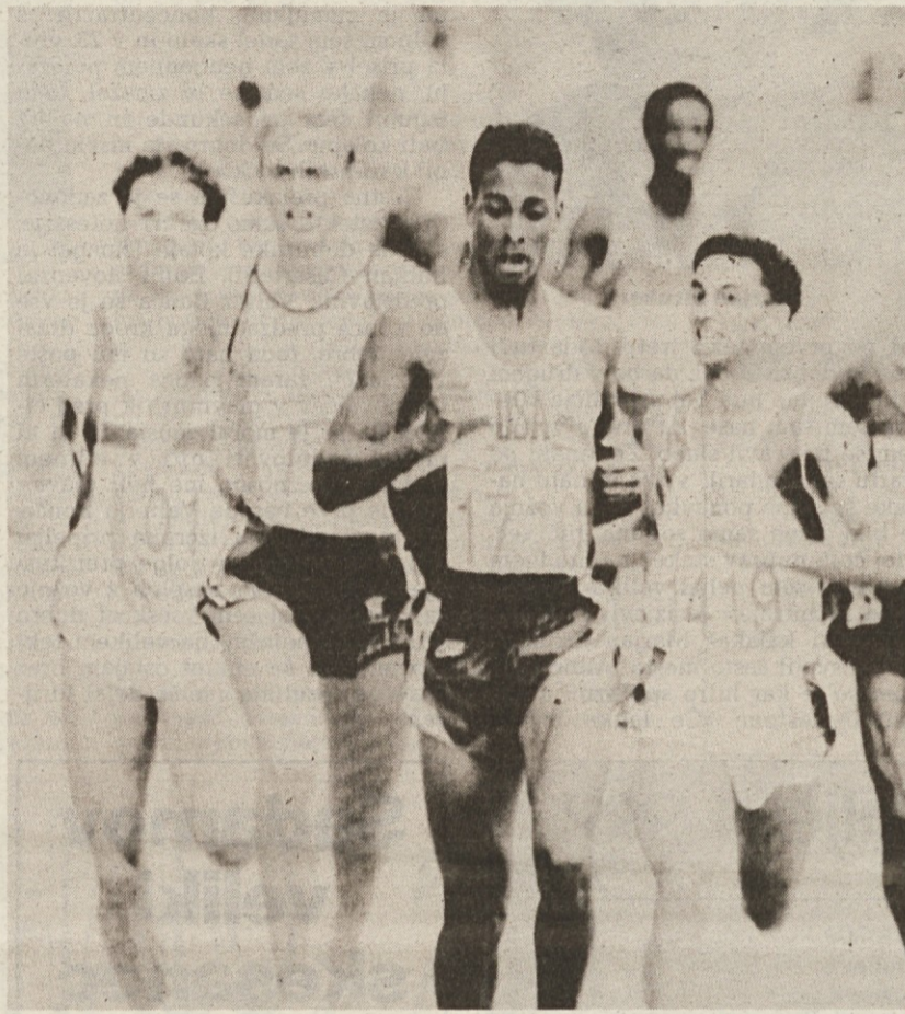
Trenutek s kvalifikacij teka na 1.500 m