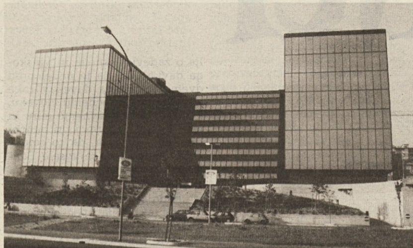
Nova Pomorska palača, sedež Tržaškega Lloyda

Rekapitalizacija družbe na osnovi novega industrijskega projekta in ohranitev njena sedeža v Trstu na podlagi strateških in ne zgolj lokalističnih kriterijev sta temeljni zahtevi v dokumentu o Tržaškem Lloyd, ki so ga včeraj dopoldne sprejeli načelniki svetovalskih skupin v tržaškem občinskem svetu. Pobudo za sestanek je dala Demokratična zveza potem, ko je upravni svet grupe Finmare formalno sklenil združiti v eno samo družbo največja italijanska javna ladjarja, Tržaški Lloyd in genovska Italia di Navigazione.