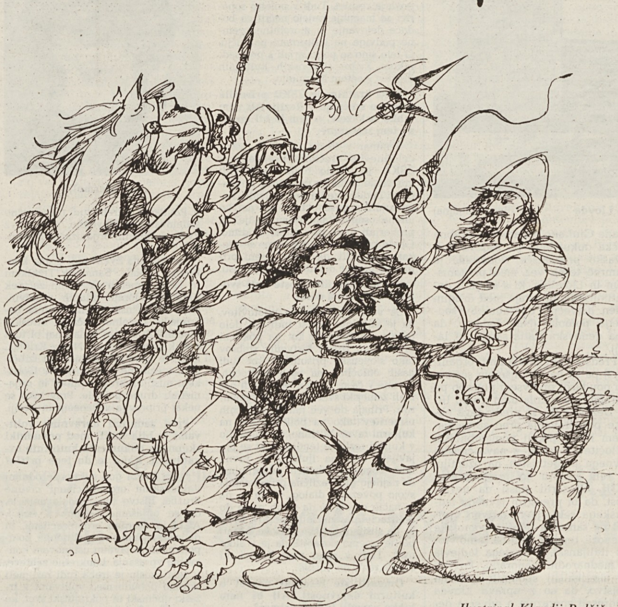
Ilustriral Klavdij Palčič

Od Lokva je bilo čuti zvon. Mož je snel kučmo in se pokrižal. Potem je mislil: »Ali ne molimo? Kaj se je ustil zadnjič Id-