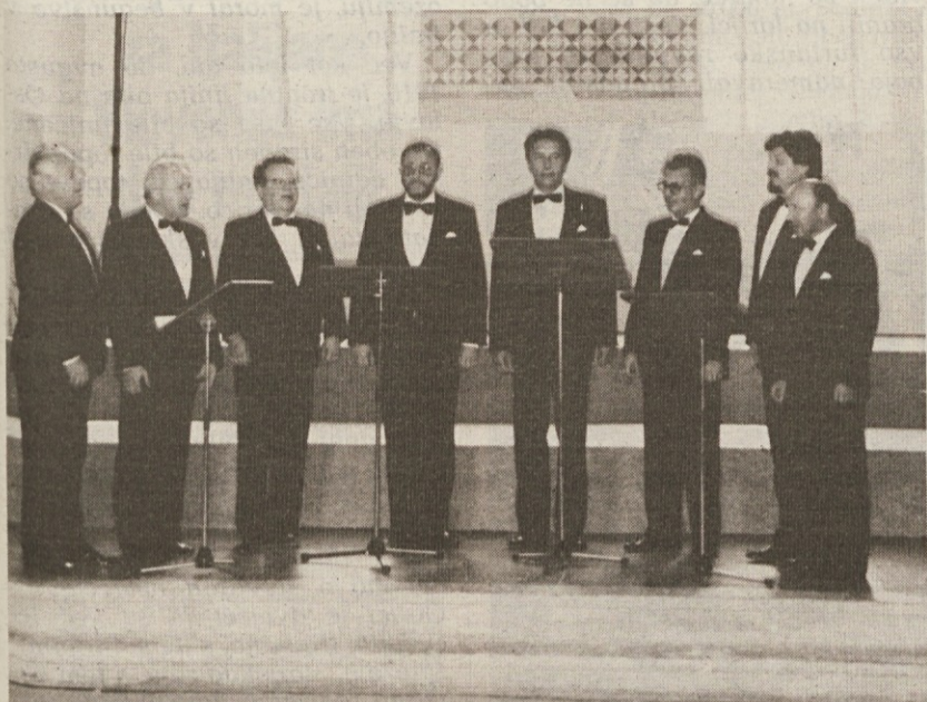
Slovenski oktet v Čedau