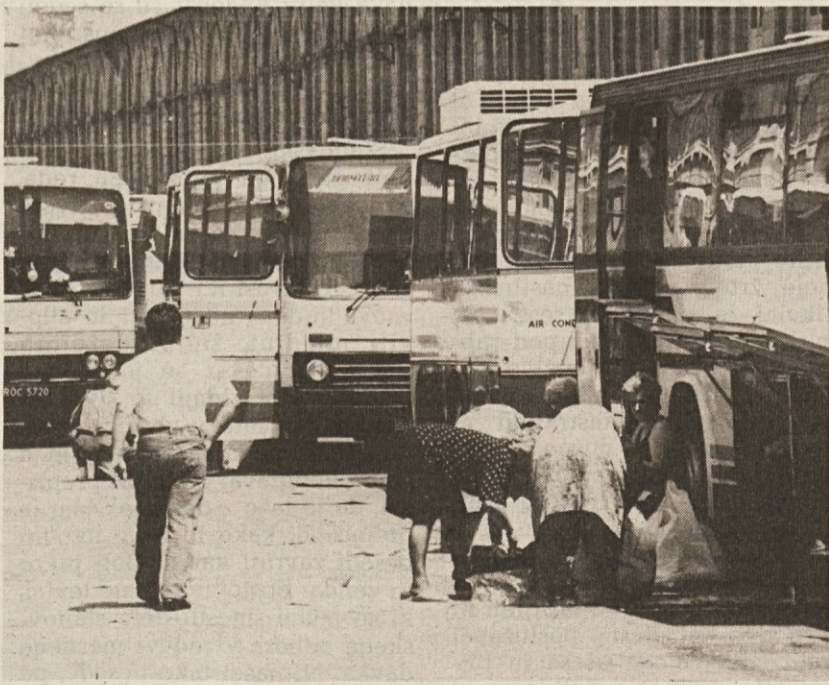
Odjemalci iz vzhodnoevropskih držav se po nakupovanju odpravljajo domov

Če se radovednež ne nahaja v prodajalni zaradi nakupovalne mrzlice, ampak zato da bi postavil samo kako vprašanje lastniku trgovine, mora potrpežljivo počakati na zaprtje prodajalne, ko si