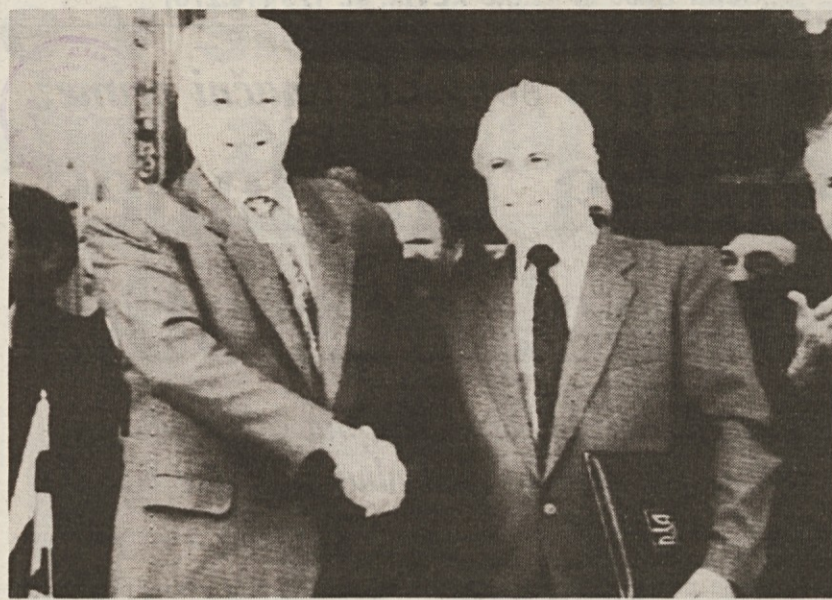
Boris Jelcin in Leonid Kravčuk po sklenjenem dogovoru

zadovoljni predvsem mornarji in vojaki ter ljudje s Krima. Kijevu je uspelo preprečiti nevarno konfrontacijo s protiučajinskim razpoloženjem v brodovju in med prebivalstvom, Moskva pa je situacijo nekako zamrznila za boljše čase, ko bodo Ukrajinci pokazali večje razumevanje. Vsekakor pa se je Jelcin za nekaj časa rešil skrajno problematičnega vprašanja, ki je ob ukrajinskih povzročal tudi ruske nacionalistične izpade. Skupno rusko-ukrajinsko poveljstvo nad notnim brodovjem bi moralo pomiriti strasti. Če je Jelcin zadovoljen, in tega včeraj s Kravčukom ni skrival, pa v generalstabil nekdanje sovjetske vojske ne skrivajo razočaranja, ker je včerajšnji sporazum dokončno pokopal zamisel o skupnih vojaških silah SND.