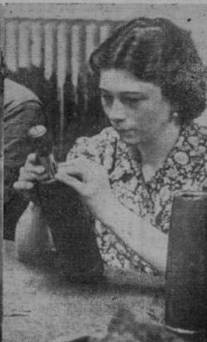
V nemških tovarnah za strelivo uporabljajo tudi ženske delavke, ki montirajo na granate vžigalnike. Je to zelo nevarno delo