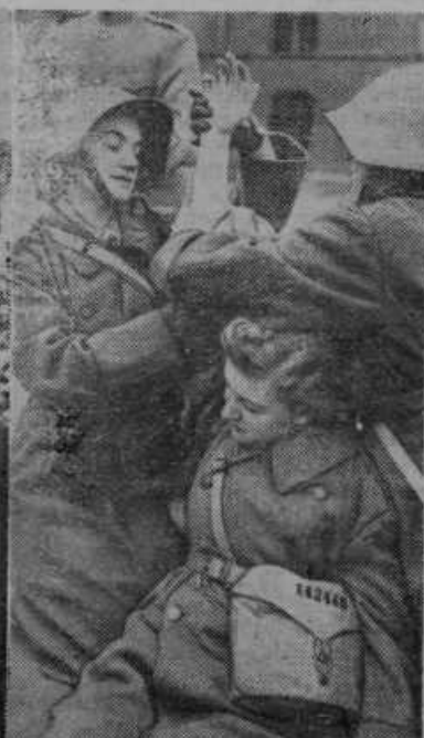
V nemško armado so uvedli ženske sanitejke kot pomožne čete. Slika nam predstavlja tri sanitejke pri vezbanju

da so nesrečnemu bitju ohranili življenje. Deček je dobil rento, naučil se je krojaštva. — Regent Horthy mu je rento spet obnovil ter jo bo najmlajši invalid svetovne vojne dobival do kraja življenja.