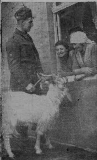
Angleško vojaštvo v Franciji v prostem času obiskuje Francozije in se v pomenku z njimi uči njihovega jezika