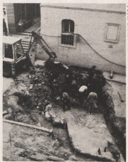
Temelji mestnega obzidja med izkopavanjem. Vhod na fasadi Obrezove hiše kaže na nekdanji nivo vhoda v mesto.

Na tak način bi bilo potrebno rekonstruirati tudi ostale prehode v mestu, ki so bili zaradi neobstoynosti barve na kockah zamenjani z asfaltno prevleko. Gre za prehode pri mostu, pred knjigarno, na ustju Ceste komandanta Staneta 14 in pri vstopu na Ulico talcev.