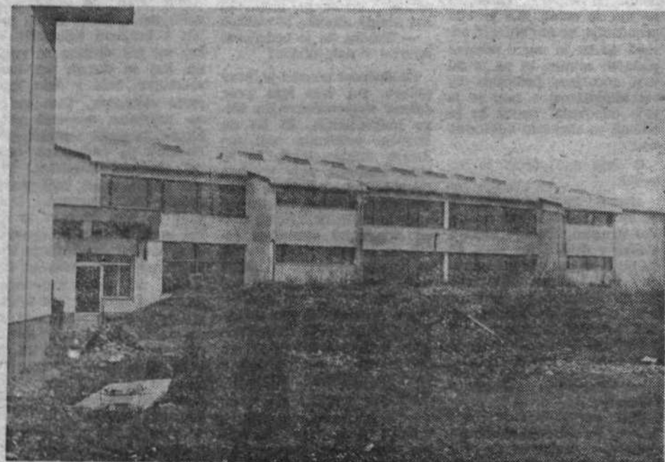
Iz sredstev samoprispevka so v Dolu dogradili nov trakt osnovne šole, tako da bodo lahko učenci kmalu obiskovali pouk same v eni izmen. V šolo, ki ima tudi zelo moderne telovadnice, bodo hodili tudi otroci iz Doljskega.