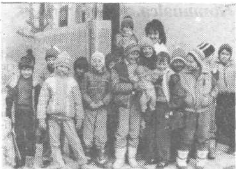
Skupina otrok pred odhodom iz Zapotoka

Kajpak, otroci so tega dne zaključili svoje teden dni dolgo počitniško zimovanje v domu, ki jim ga je pripravila občinska Zveza prijateljev mladine, in zdaj odhajajo domov, na njihovo mesto pa so prišli novi, še mlajši, ki si prav tako žele vrskati vsaj kanček »nadomestnih« počitniških radosti v domu, če jih bo sneg že dokončno pustil na cedilu.