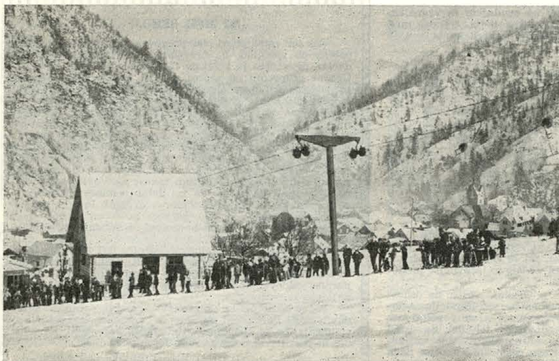
Tudi vlečnica v Črni je polno zasedena