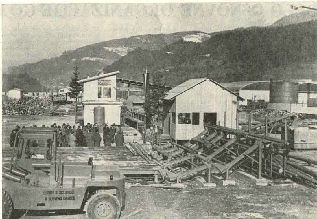
Majhna svečanost ob otvoritvi skladišča