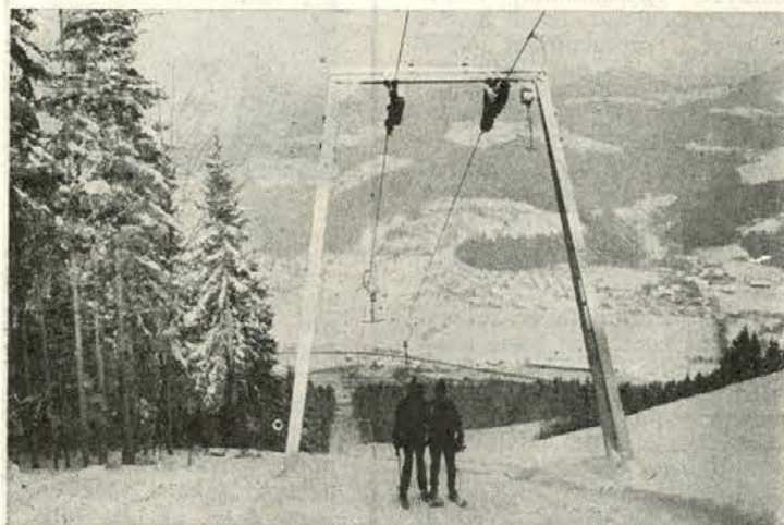
Večja žičnica na Rahtelovem vrhu

Ko pokrije sneg zemljo, se prične najmočnejše turistično romanje v narodo. Smučanje postaja najmasovnejši šport. Dušan Dretnik, dipl. inž. gozd.