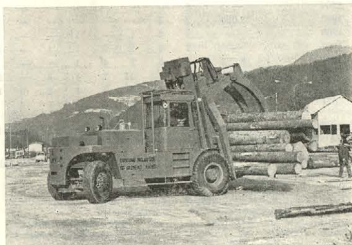
Viličar razbremenjuje delavce

»Ponosni smo, da na naš največji praznik — dan republike, tudi mi lahko počastimo s pomembno delovno zmago. Pri nas je redek primer, da kak-