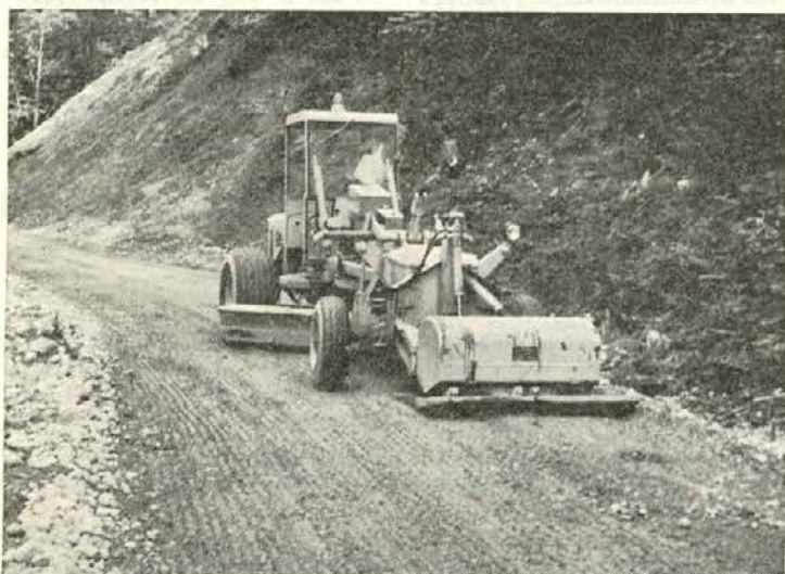
Stabilizacija vozišča s cementom je bila v Sloveniji prvič uporabljena na cesti Suhi vrh

Takšna realizacija bi glede na opravljeno delo v preteklih letih pomenila občutno nazadovanje. Posledice bi bile: odpušcanje ljudi in nezadostna uporaba strojev. Da bi kljub pomanjkanju dela v okviru našega podjetja napredovali, smo v zadnjih letih osvajali nove delovne postopke in nova področja.