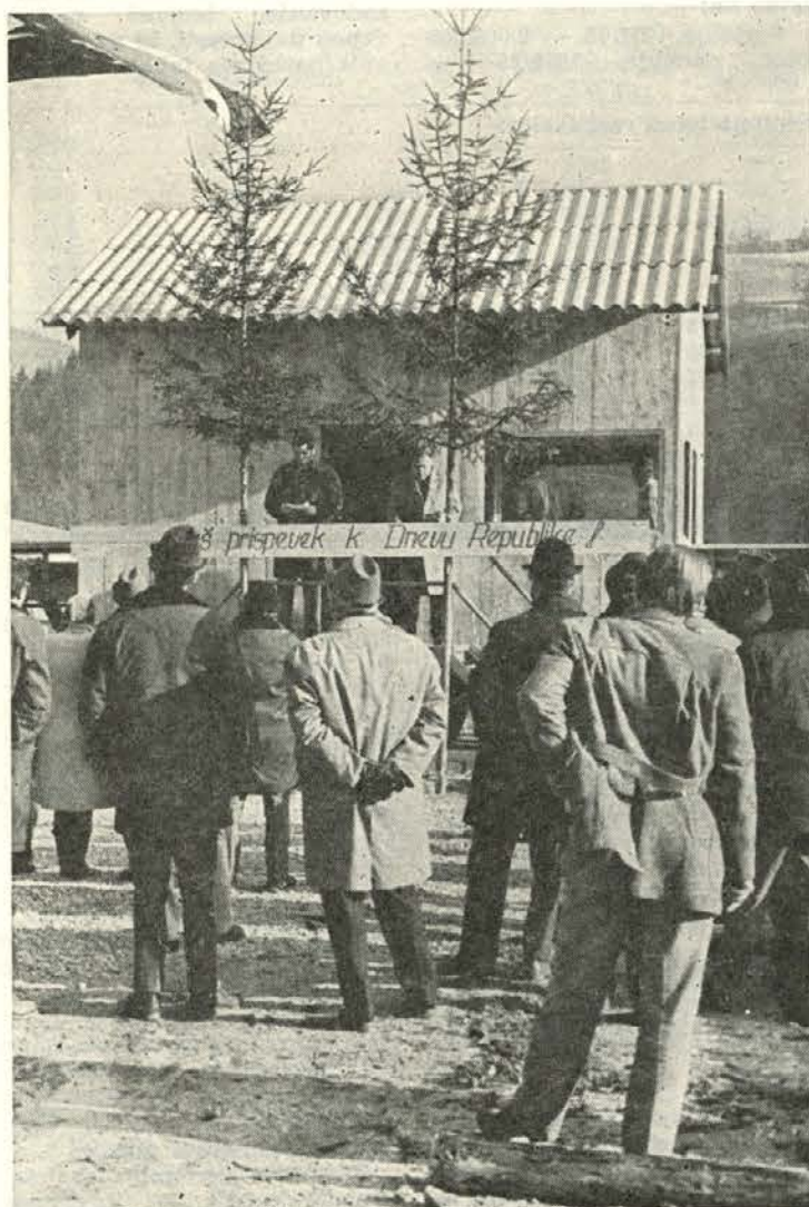
Otvoritev lesnega skladišča v Otiškem vrhu ob dnevu republike