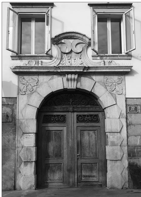
Zoisova palača, glavni portal.

Bogat glavni portal je nameščen med sedmo in osmo okensko osjo z leve sicer 12-osne fasade. Sestavljen je iz pravokotne osnovne plošče, izstopajočega polkrožno zaključenega portala, ravne profilirane grede in volutaste atike. Polkrožni portalni del je rustični: sestavljen je iz kvadrastih ali trapezoidnih kamnov s trikotnimi prizmastimi zaključki, ki imajo različno globino in teksturo oziroma se menjujejo bolj grobo obdelani in izstopajoči kamni z bolj plitvimi in gladkimi kamni. Na vrhu je volutasta agrafa. V obeh obločnih poljih sta reliefno upodobljena cvetova z zavihanimi listi, ki spominjajo na akant. Greda je nad agrafu rahlo dvakrat stopnjevana. Nad njo je volutasta atika, ki se zgoraj zaključuje s segmentnim profiliranim lokom. Podpirata ga voluti, ki tečeta na strani in se spodaj zaključujeta v nekakšnem zavitem listovju, ki pa je na obeh straneh (pod okvirom okna)