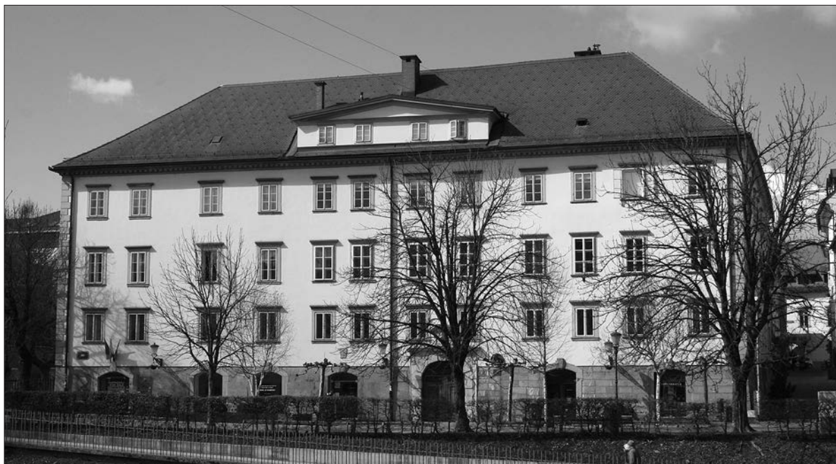
Zoisova palača v Ljubljani.

Iz zapisanega sledi, da so pisci letnico 1798 večinoma interpretirali kot leto izdelave glavnega portala in/ali leto zadnje razširitve palače in poenotenja fasade, le Germ je menil, da je bil portal izdelan leta 1589 in predelan v 18. stoletju.