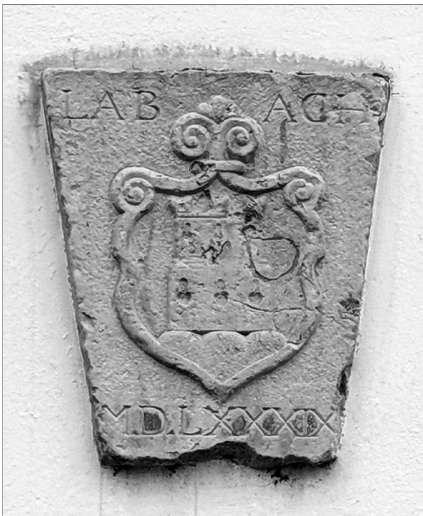
Zoisova palača, grb iz nekdanjega stolpa mestnega obzidja.

and the semi-circular arch of the portal features a relief of a flower. Above the shaft is a volute-shaped attic, complete with a pair of smooth volutes and a pair of upside-down acanthus leaves. The portal, originating from the first Zois corner house, was transferred to the current location about 1765, when the house was merged with the next-door Erberg Mansion. Probably built in the workshop of the master stone carver Luka Mislej between 1710 and 1727, the portal represents a high-quality and original work that stands out from the rest of Ljubljana's contemporary production. Other portals are less elaborate and constructed in the late-Baroque design. The first, fourth, and sixth portals from the left were built about 1805, during the last expansion of the mansion, and may be ascribed to Ignac Prager, an architect from Ljubljana. The second, third, and seventh portals were added in 1832, during the last major restoration of the mansion, formally imitating the former three.