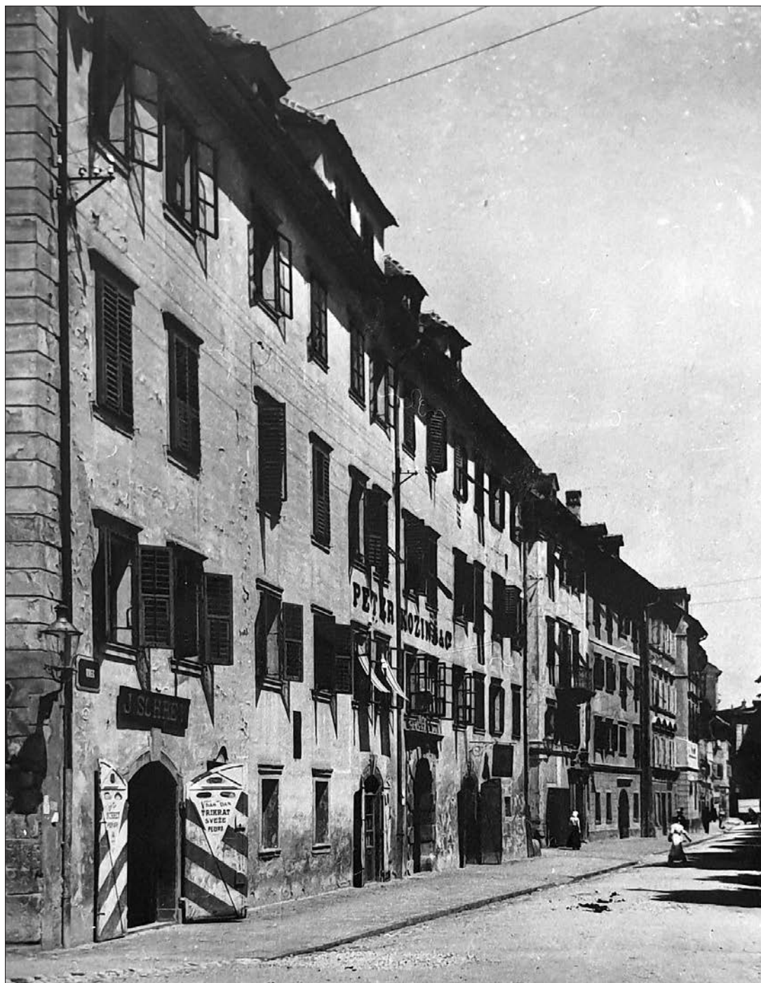
Zoisova palača med letoma 1918 in 1932 (ZVKDS, območna enota Ljubljana, fototeka).