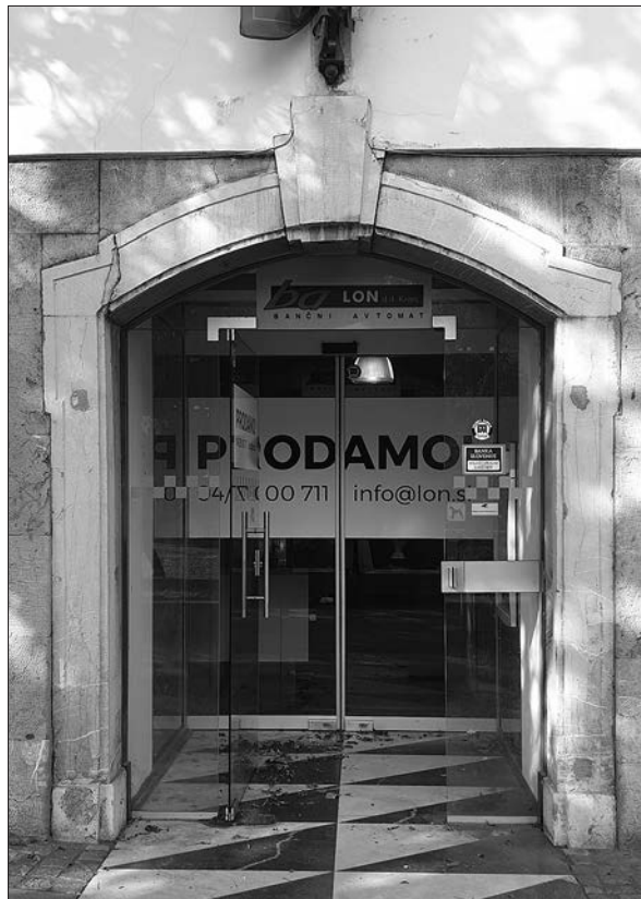
Zoisova palača, stranski portal, prvi z leve (foto: M. Kemperl).

Ostalih šest portalov glavne fasade Zoisove palače ima enako obliko. Preprosta podboja se na zunanji strani proti vrhu malenkost razširita (zato govorimo o ušesastem portalu) in preideta v elipsast lok, ki je enkrat zalomljen. Precej velik temenski kamen je stopnjevan. Nobeden od portalov ni datiran. Iz fotografije, ki je bila posneta kmalu po potresu leta 1895, je razvidno, da sta bila takrat levo od glavnega portala le dva taka portala, in sicer tisti na skrajni levi strani, torej prvi z leve, in tisti, nad katerim je vzdana grbovna plošča, torej danes četrti z leve. Glede na nju-