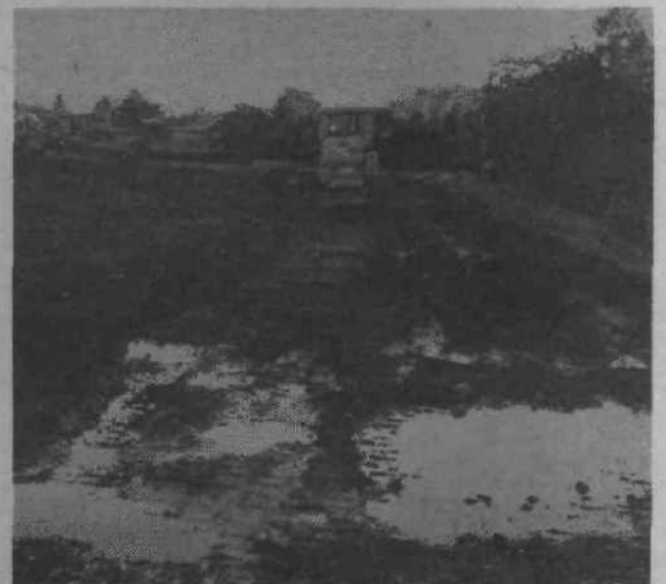
Po novi cesti iz Črnuče bomo na Titovo cesto zapejeli nasproti postopja krajevne skupnosti Stožice (pri Buzoliniju). Dela pri gradnji kolektorja in nasipa so se že začela.

Sredstva, predvidena za izgradnjo celotnega programa, žal že danes ne zadoščajo več. O vzrokih bodo spregovorili