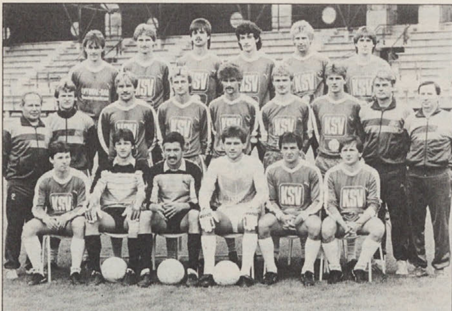
SV Kapfenberg je letos v kvalifikacijskih tekmah premagal Rapid Linz in Chemie Linz ter je po petih tekmah v II. ligi brez poraza na odličnem 5. mestu. Kapfenberg je klub z veliko tradicijo, ki je v prejšnjih letih bil zastopan v vrhunskem avstrijskem nogometu. Letos je SV Kapfenberg zopet na poti v I. ligo, seveda pa hočejo Štajerci tudi v pokalu priti čim dalje.