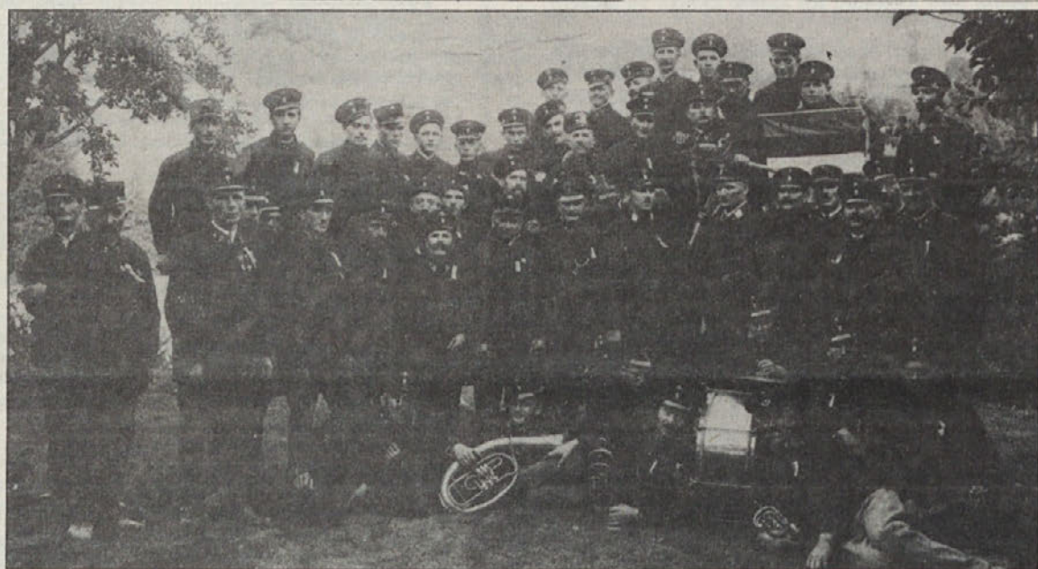
Borovniški gasilci; posnetek je verjetno narejen leta 1928, leto dni po ustanovitvi gasilskoga društva.