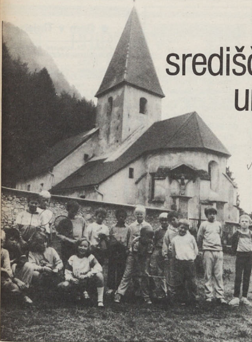
Del mladih umetnikov se je postavil pred kamero našega fotografa.