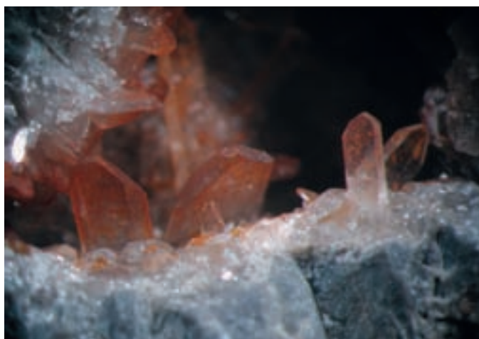
Kristali barita so veliki do 5 mm in prekriti z rdečkastimi oprhi. Najdba in zbirka Vilija Rakovca.