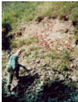
Zgornjeperske plasti, v katerih lahko najdemo kristale barita, kalcita in pirit.

Najlepše kristale barita smo našli pod kmetijo Čeh, severno od naselja Kolovec. Kristalizira v manjših gnezdih v satistem dolomitiziranem apnencu na desnem bregu potoka. Popolnoma prozorni kristali barita so veliki do 10 mm, v glavnem pa prevladujejo le nekajmilimetrski. Kristali so sploščeni po c-osi in podaljšani v smeri a-osi, zato so tankoploščati.