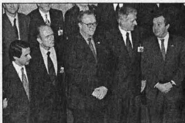
Na posnetku predstavniki držav Evropske zveze skupaj s slovenskim premierom dr. Janezom Drnovškom (drugi z leve), ko so 13. decembra v Luxembourgu sklenili, da med drugimi prično pogajanja s Slovenijo za pridruženje.

Predsedniki vlad in držav EZ so na vrhu dosegli še dogovor o ustanovitvi posebnega evro-sveta, ki bo združeval tiste članice petnajsterice, ki bodo 1. januarja 1999 uvedle evro. Drnovšek je izjavil, da ima Slovenija namen, da bo med članicami, ki bodo takoj sprejele skupni denar.