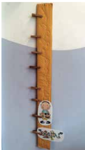
Slika 3: Učenci odstranjujejo sličice za dejavnosti, ki so že opravljene.

na primer kdo zelo lačen, lahko z urnika razbere, katere dejavnosti še moramo opraviti, preden gremo na kosilo. Z njega lahko tudi razbere, kdaj bo šel domov oziroma kdaj se bo pričelo podaljšano bivanje. Predstavlja si, kako bo dan potekal in katere dejavnosti so predvidene. Kadar urnik pozabim sestaviti, me učenci vedno spomnijo. Zelo jih moti, če ga nimamo. Kadar imamo na primer športni dan, ga ne sestavljamo. Takrat vsaj en otrok reče: »Kaj pa urnik?«