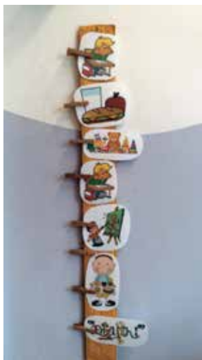
Slika 2: Slikovni urnik.