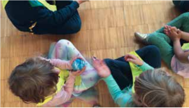
Slika 1: Cofeka potuje od otroka do otroka.

vrne v krog, ko se bo umiril. Običajno ni potrebno prav pogosto pošiljati otrok v klop, saj želijo v jutranjem krogu dejavno sodelovati. Prav je, da zagotovimo tišino, da se slišimo, saj le tako lahko pogovor poteka nemoteno. Le če je tišina, lahko ustvarimo prijetno in sproščeno vzdušje. Na otroka, ki je nemiren, sem še posebej pozorna. Kadar mu uspe zbrano sodelovati, ga pohvalim.