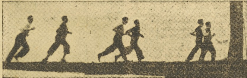
Mladinci tečejo kros

Skrbno urejeni stadion na šolskem dvorišču, katerega sliko smo v Poletu objavili že ob njegovi otvoritvi, napravi na fizkulturnika že takoj v začetku dober vtis. Tekališče meri