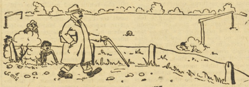
Tako je bilo nekoč, ko je šel profesor mimo igrišča

Sarajevo, 30. nov. Pred 2000 gledalci je bila odigrana danes ob dokaj neprijetnem vremenu prijateljska tekma med Milicionerjem iz Sarajeva in Milicionerjem iz Zagreba. Končala se je z zmago Zagrebčanov 2:0 (0:0). Gole sta dala Kolar in Djurdjević.