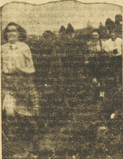
Mladinke tik pred ciljem

Pred očmi imamo ravnatelje nekdanjih srednjih šol, pred katerimi smo se morali nekoč dijaki-sportniki skrivati, kadar smo hodili na tekmovanja in celo nastopati pod drugimi imeni, da nismo bili izključeni z šole. Če se je slučajno med nogometno tekmo za prvenstvo šole pojavila blizu igrišča postava kakšnega profesorja, je bila tekma v trenutku prekinjena. Kot da bi nas pokosil s strojnico smo popadali v travo in čakali vse dotlej, da je »nevarnost« minila, in šele potem smo nadaljevali s tekmo. Kljub temu pa smo drugi dan lahko dobili slabo oceno, če nismo znali dobro prestaviti znanega latinskega stavka »mens sana in...« Ta-