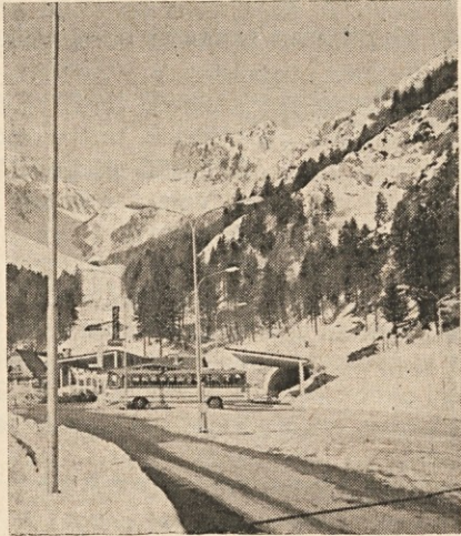
Obmejni prehod Ljubelj (1050 m) — izhodišče za Zelenico

Najprej je seznanila „Hofkanzlei“ v spomenici z dne 28. junija leta 1821 „K. K. Kommerz-Hofkommission“ (trgovsko ministrstvo) na Dunaju z vsebino tega načrta z opombo, da je zahtevala od gubernija v Gradcu in Ljubljani (najvišji upravni uradi v deželah) mnenje o premoženjskem stanju, kreditu in morebitnih drugih družabnikih obeh predlagateljev, o političnih in trgov-