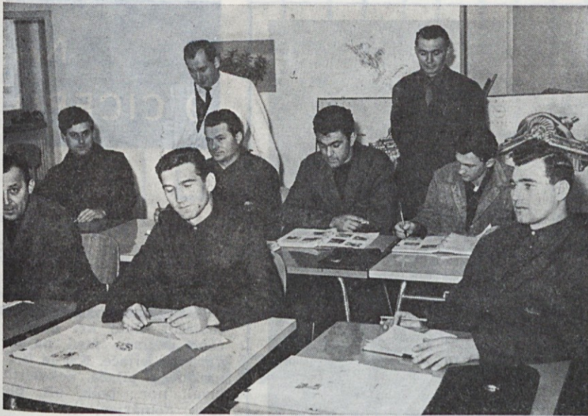
Prvi tečaj avtomehanikov Avtotehne v Jugoslaviji leta 1965