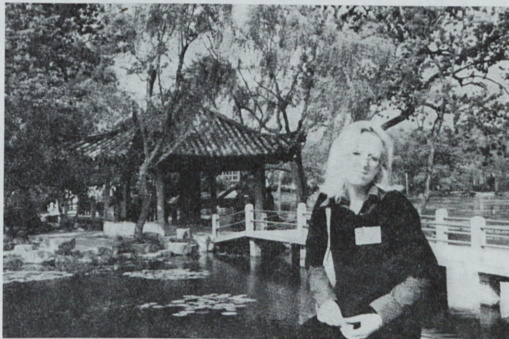
Avtorica potopisa v parku HAN ČOU.