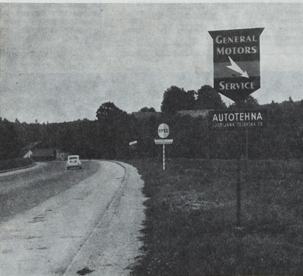
Prvi Gm in OPEL znak na dolenski vpadnici leta 1962