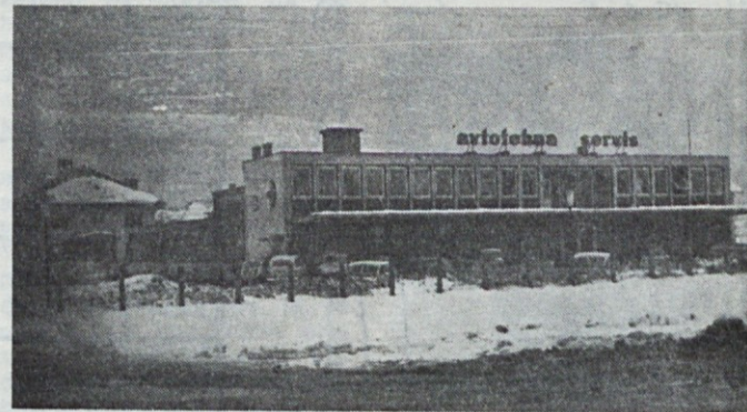
Objekt na Celovski cesti 175, leta 1964. Še brez nadzidka pa tudi bencinske črpalke še ni pred njim