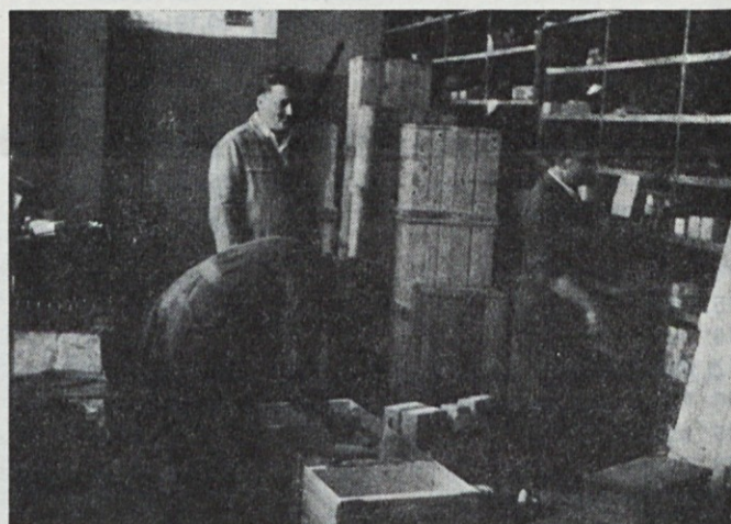
Notranjost prvega konsignacijskega skladišča leta 1957 na Celovški cesti 36