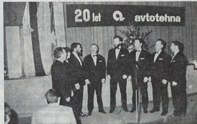
Nastop Koroškega okteta na naši proslavi 20-letnice, v kino Komuna 1973