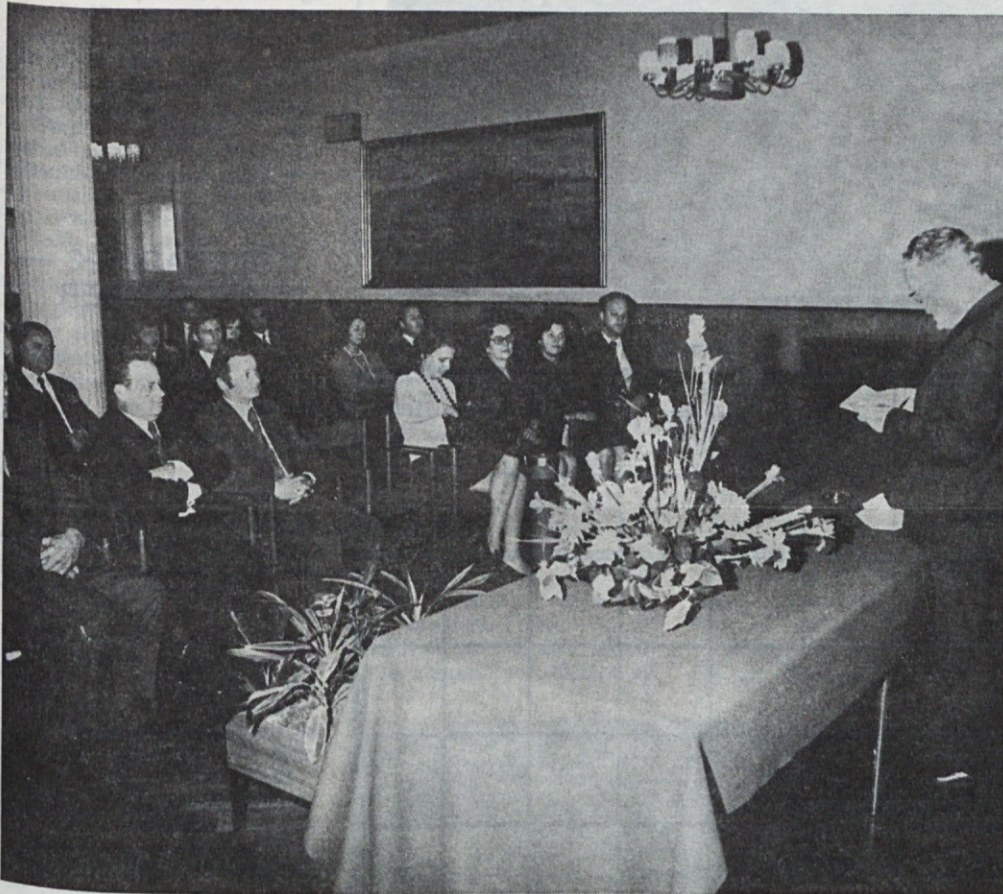
S slavnostne seje delavskega sveta Avtotehne ob 20-letnici 1973