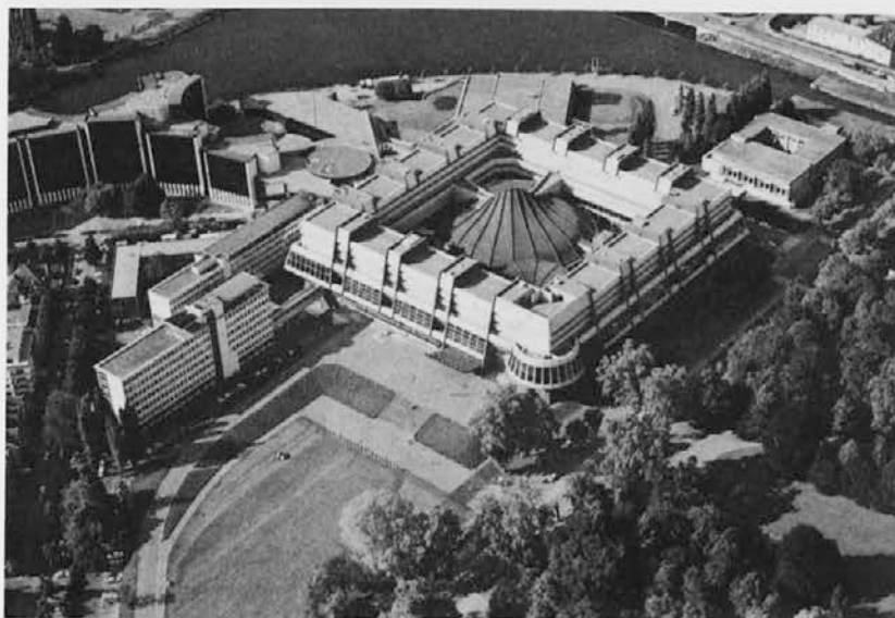
Evropski parlament v Strasbourgu

Morda je prav, da se pred volitvami malo potrudimo in skušamo razumeti, kaj pravzaprav je Evropski parlament in kakšno vlogo igra v veliki areni Evropske unije. Letos bo izvoljenih kar 567 poslancev Evropskega parlamenta (število poslancev se je v primerjavi s prejšnjo zakonodajno dobo povečalo predvsem zaradi združitve obeh Nemčij). To bodo šele četrte direktne volitve, saj so pred 17. julijem 1979 evropske poslance imenovali kar nacional-