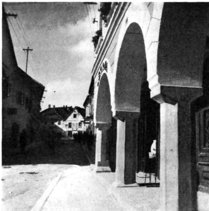
ARKADE BERGMANNOVE LEKARNE V NOVEM MESTU

Samostanski lekarni v Stični in Kostanjevici sta pa, ker v teh krajih še ni bilo javnih lekarn, delovali pod zgoraj imenovanimi pogoji naprej do ukinitve samostanov (1784.). Inventar lekarne v Stični je delal protomedicus Josip Heimann. On poroča, da je bila zaloge lekarne za časa ukinitve že majhna in da so bila mnoga zdravila že stara in neuporabljiva. Izročili so jih ranocelniku Ebertu v Stični, da uporabljive porabi za revne bolnike. Razumljivo je, da samostanski prebivalci, ki so že mesece z žalostjo pričakovali cesarsko odločbo o bodoči usodi svoje hiše, niso več obnavljali zaloge svoje lekarne. Lekarniške priprave, orodje in posodo so cenili na približno 62 renskih goldinarjev. Pri tej ocenitvi so računali za 1 funt bakra, medenine ali kositra 18 krajcarjev. Med predmeti laboratorijskega inventarja naj omenim 5 tehtnic, 3 steklene re-