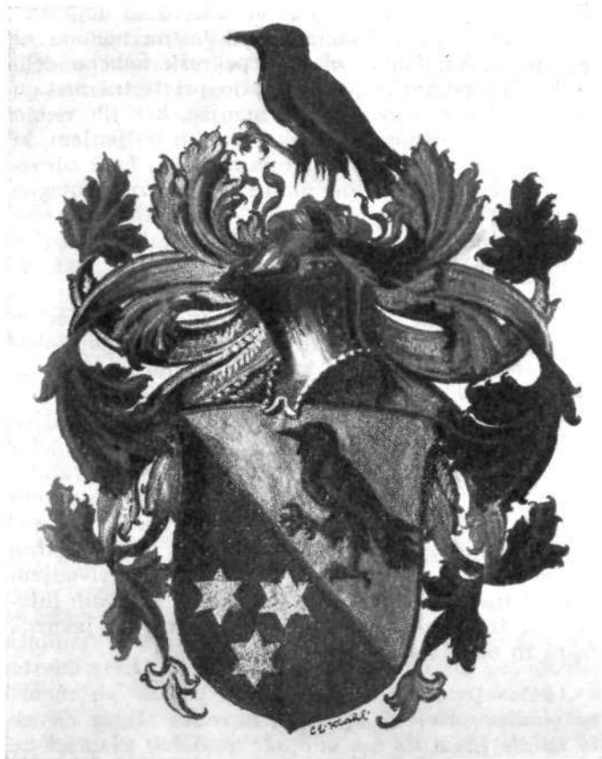
GRB MIHE IN PETRA KLAUSA PO NAVEDBAH GRBOVEGA PISMA

nove lekarne veliko gmotnih sredstev za nabavo oprave, polic, posode in raznih priprav ter zaloge zdravil, ki so jih tedaj nabavljali navadno v Benetkah ali Augsburgu, in ker tedaj še ni bilo nobenih kreditnih zavodov ali zadrug, ki bi mogli začetniku s posojilom pomagati, je stanovska deželna vlada podprla novega lekarnarja s tem, da mu je dala posojilo v obliki predujma na njegovo deželno plačo. Plače toliko let ni prejemal, dokler to posojilo ni bilo poravnano.