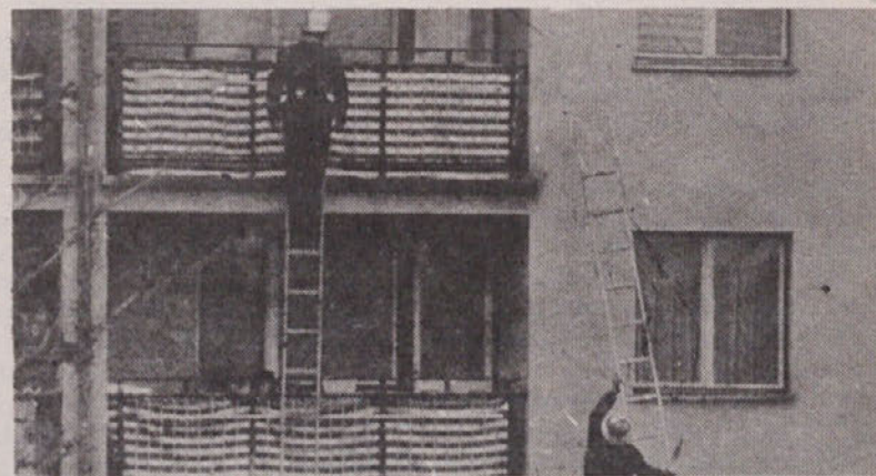
Člani gasilskih enot so prikazali reševanje v stolpnih s pomočjo lestev

4. Pripraviti je treba predlog programa za pionirje in mladince ter v prihodnje za njih organizirati ločeno tekmovanje, saj bo s tem dana še večja pobuda med mladino. 5. Nastaviti je potrebno profesionalnega tajnika, ki bo primerno