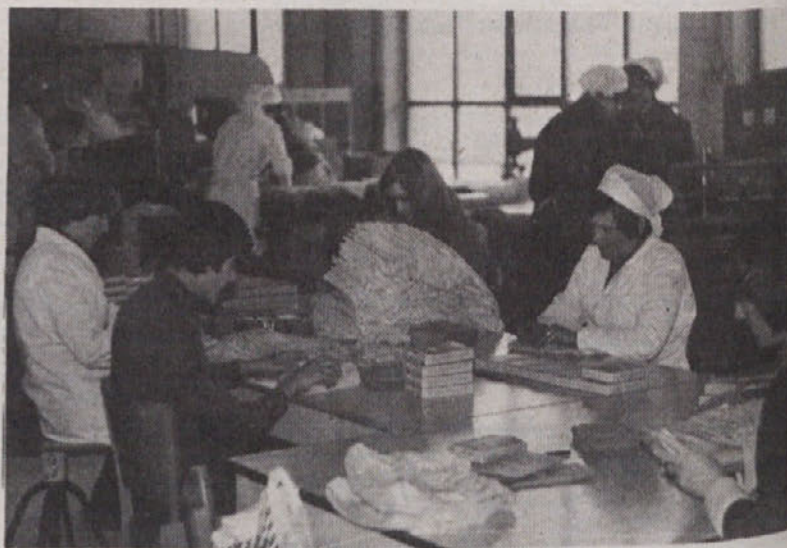
Učenci OŠ Martin Koželj Dob med delom v TOSAMI

Mladinci so se za delovno sodelovanje prostovoljno in zavestno odločili, zato tudi uspeh ni izostal. Denarno nagrado, ki so jo učenci