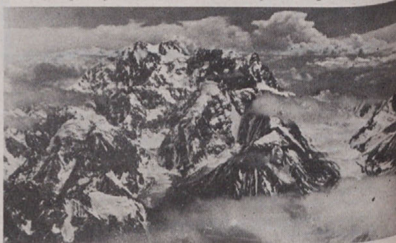
Tako izgledajo vrhovi Tirič Mira, na katere se bo povzpela poljsko-jugoslovanska alpinistična odprava

Na pot so odšli v nedeljo, 11. junija in sicer v Katowice, kjer so se sešli s poljskim delom odprave. V Varšavi so uredili še zadnje formalnosti nato pa se odpeljali preko Belo Rusije, Kazahstana, Armenije in Uzbekistana do mejne reke Amu Darje in prišli v Afganistan. Od tu