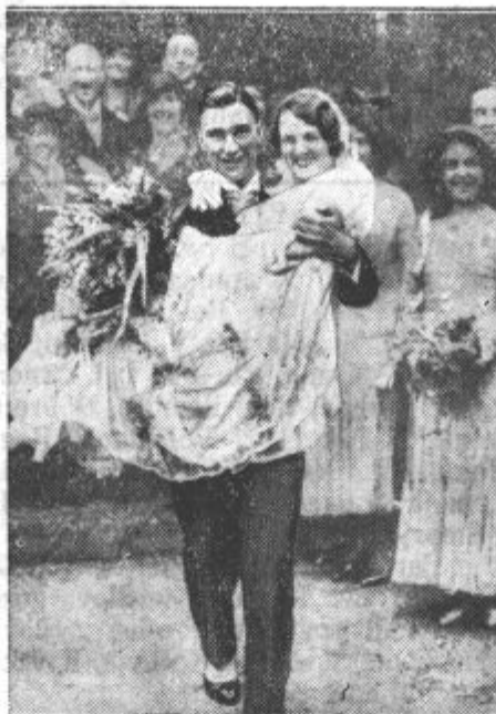
Zenin nese svojo nevesto na rokah iz cerkve. Star običaj v grofiji Yorkshire na Angleškem, kateri je še danes v veljavi.